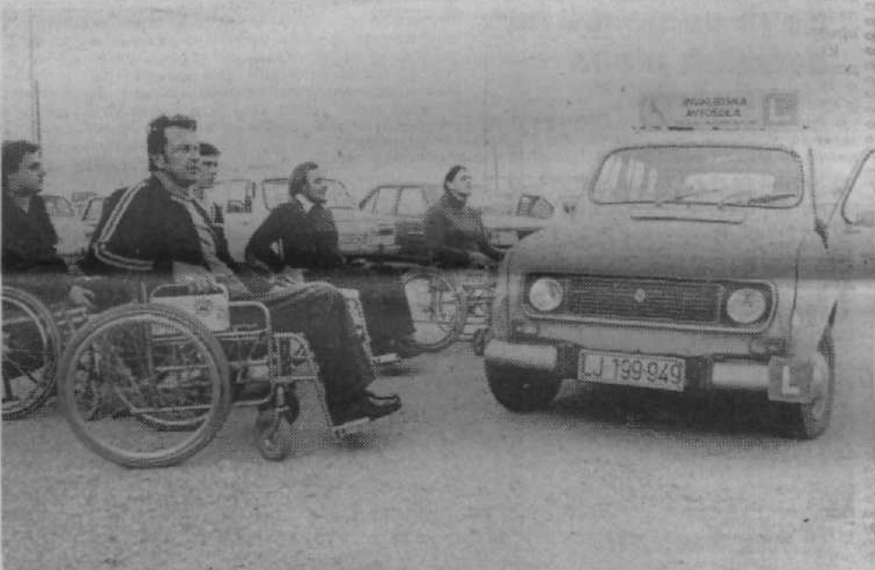
Šolanje invalidov za voznike motornih vozil naj bi postalo sestavni del rehabilitacije. Ali bomo zmogli dovolj volje in sredstev?

V očitem nasprotju pa je bilo ravnanje neke druge vzgojiteljice, ki ni znala obvladati svoje skupine. Tudi v tej so bile deklice. Vznemirjene,