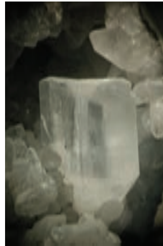
Zdvojeni kristali kalcita v črnem apnencu; 4 x 2 mm. Najdba in zbirka Vilija Rakovca.