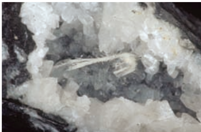
Protasti skupek barita, dolg 15 mm, na podlagi iz kristalov kalcita. Najdba in zbirka Vilija Rakovca.