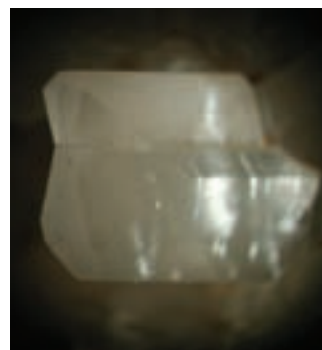
Dvojček kalcita z lepo razvitim vrhom kristala; 3 x 2 mm. Najdba in zbirka Vilija Rakovca.