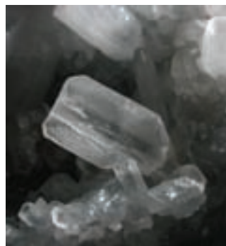
Dvojček kalcita v apnencu; 3 x 2 mm. Najdba in zbirka Vilija Rakovca. Foto: Miha Jeršek

Poredko so med kristali kalcita in markazita priraščeni drobni beli ali pa prozorni kristali fluorita v obliki kock. Ponekod lahko v gnezdih kalcitovih kristalov opazimo drobne igličaste kristale sadre . Kristali so prozorni, pogosto z dvojčično rastjo, v obliki lastovičjih repov. Najredkejši so majhni kristali barita , ki ne presegajo 1 mm. Večinoma so beli in ponekod prekriti s kristali markazita. Zelo redko so razviti do 15 mm dolgi in ukrivljeni protasti skupki drobnih baritovih kristalov.