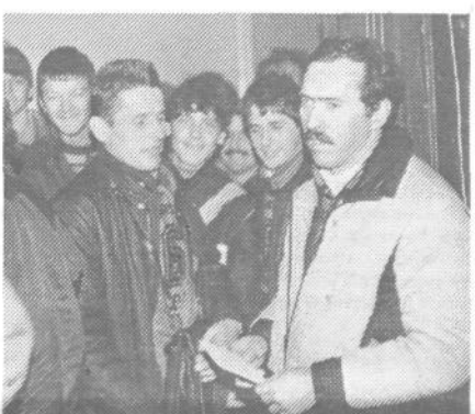
Viške rezervne vojaške starešine in mladinci čakajo, da bodo odšli reševati teoretične naloge

Letos je RK ZRVS ob pomoči RK ZSMS in v organizaciji občinskih konferenc ZRVS in ZSMS Radovljica ter