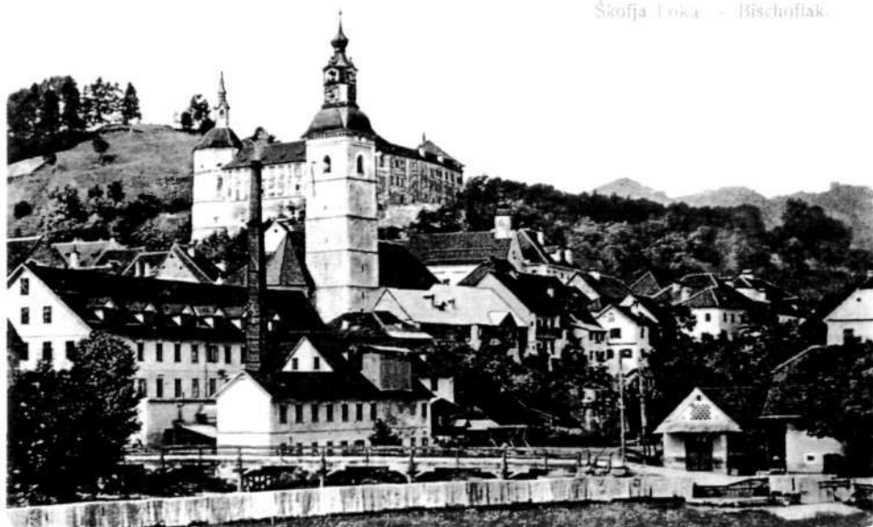
Sušenje sukna na dircah ob Lahovem mostu kmalu po letu 1900