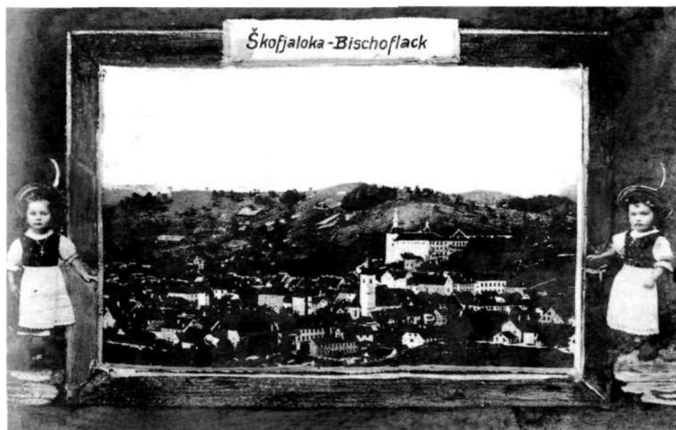
Škofja Loka pred prvo svetovno vojno.

Drugo področje, kjer je prav tako tvorno sodeloval, je bil krajevni šolski svet. Prvič je bil vanj izvoljen že leta 1873, potem pa na vsake tri leta, kolikor je trajal en mandat, razen s krajšo prekinitvijo v letih 1886–1889. Zadnja dva mandata je celo opravljal predsedniško funkcijo. Žal drugega ni pripeljal do konca. V času njegovega predsednikovanja se je še posebej zavzemal za rešitev prostorske stiske deške štiri-razrednice. Ta je bila tako prenatrpana, da je bilo vodstvo krajevnega šolskega sveta prisiljeno omejiti vpis le na dečke iz loške občine. Boljše razmere so se obetale po nakupu stanovanjske hiše ob šolskem poslopju v današnji Klobovsovi ulici. Obe stavbi so leta 1894 povežali, šolsko nadzidali in tako pridobili prepotrebne dodatne učilnice. Drugi problemi, ki se jih je loteval skupaj s člani šolskega sveta, so se nanašali na tekočo problematiko. Sprejemali so proračune in zaključne račune, skrbeli za vzdrževanje šolskega poslopja, nakup učil, izvajanje ukrepov v primerih zamud, epidemij nalezljivih bolezní itd. Leta 1893 so uspeli s pobudo, da se na osnovni šoli ustanovi t. i. gorska šola za dečke iz oddaljenih vasi. Šola je potekala ob nedeljah, in to ves oktober in november ter od marca do konca julija.