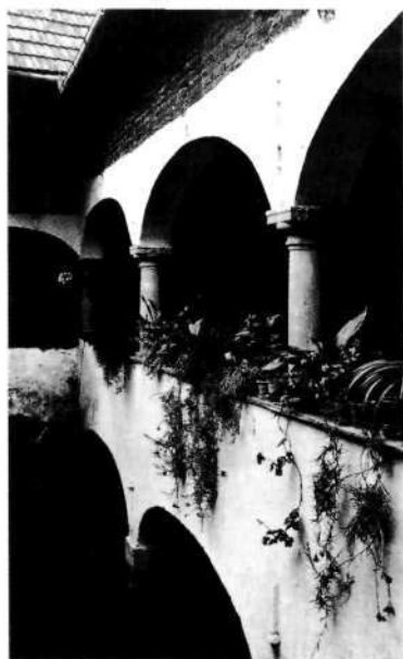
Slika Krennerjeve hiše na Spodnjem trgu v Škofji Loki (dvorišče)