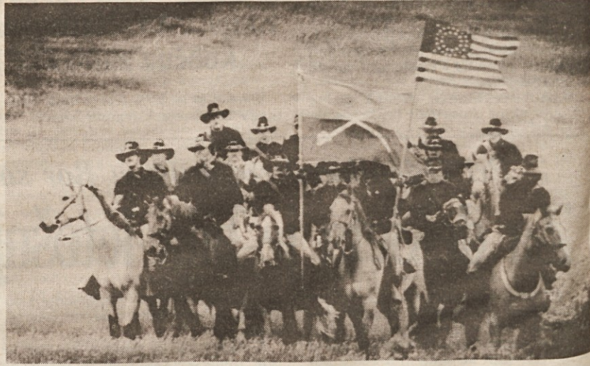
Skupina »Custerjevih konjenikov« je odprla svečanosti ob odprtju muzeja, posvečenega »generalu«, v državnem parku Abrahama Lincolna