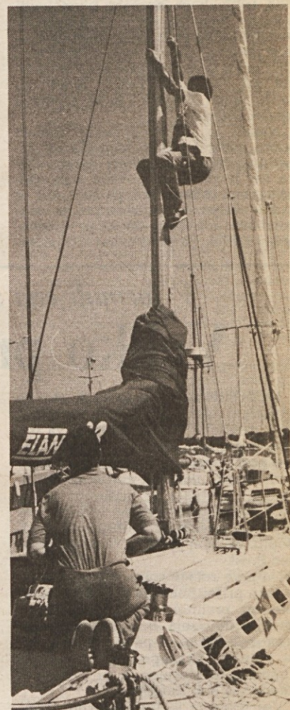
»Ogled« jadrnice s ptičje perspektive

turistov ob koncu letnega oddiha na morju kar rezervira počitek za naslednje leto. Tu imajo ljubitelji tenisa pravo oazo, saj imajo na razpolago kar 27 teniških igrišč.