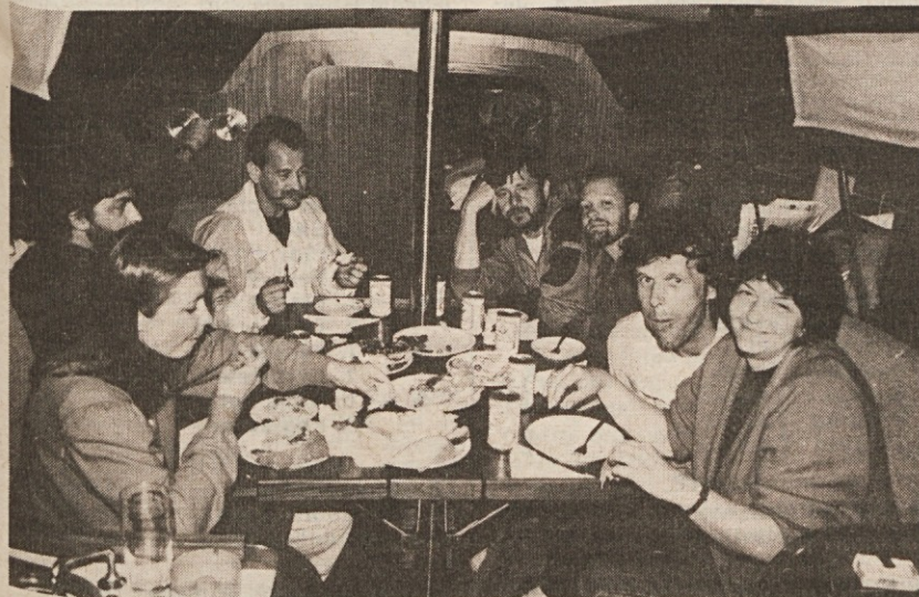
Udobnost in dovršenost Elanove jadrnice 33 sta navdušili prav vse udeležence akcije. V Vrsarju je posadka v trenutku zajelo hudo neurje, to pa so primerno izkoristili in so se v notranjosti jadrnice primerno okrepčali