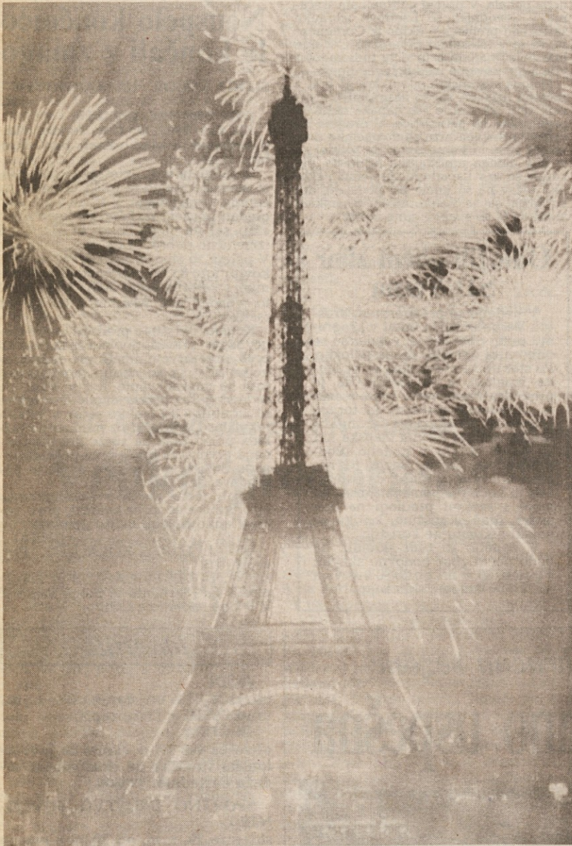
Pariz je v soboto »objel« svojo impozantno železno damo in ji voščil vse najboljše ob stotem rojstnem dnevu