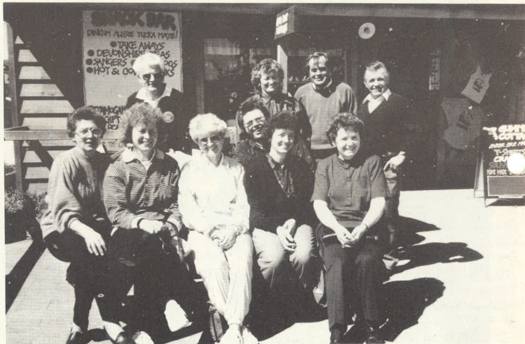
Obisk v Albury Lovci in Balinarji.