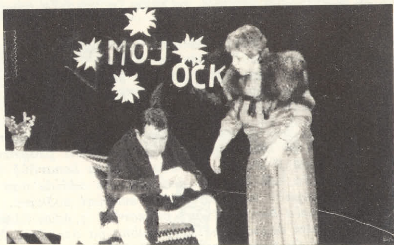
Domače zdravilo (A Klančič & T.Lenko)