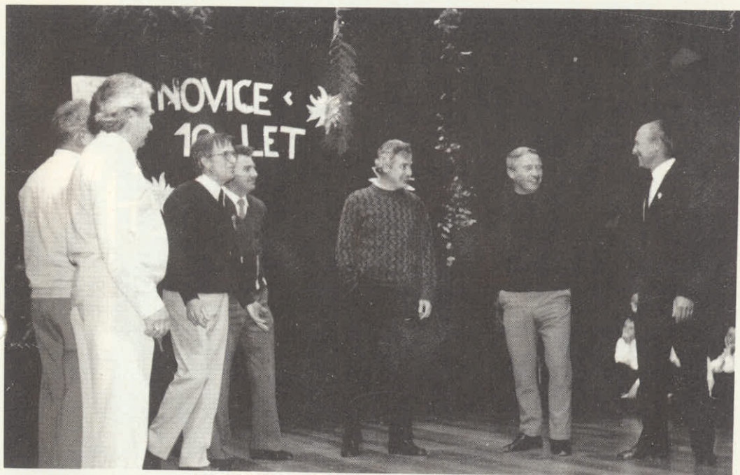
Planičarji gredo na kulturni večer.