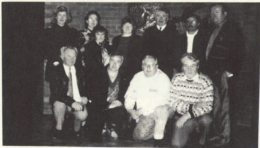
ODBOR S.D. PLANICA za LETO 1990-1991