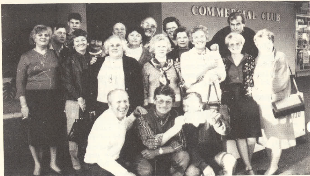
Izlet v Albury pri S.D. Sneznik