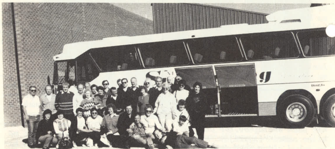
Na izletu v Albury-Wodonga