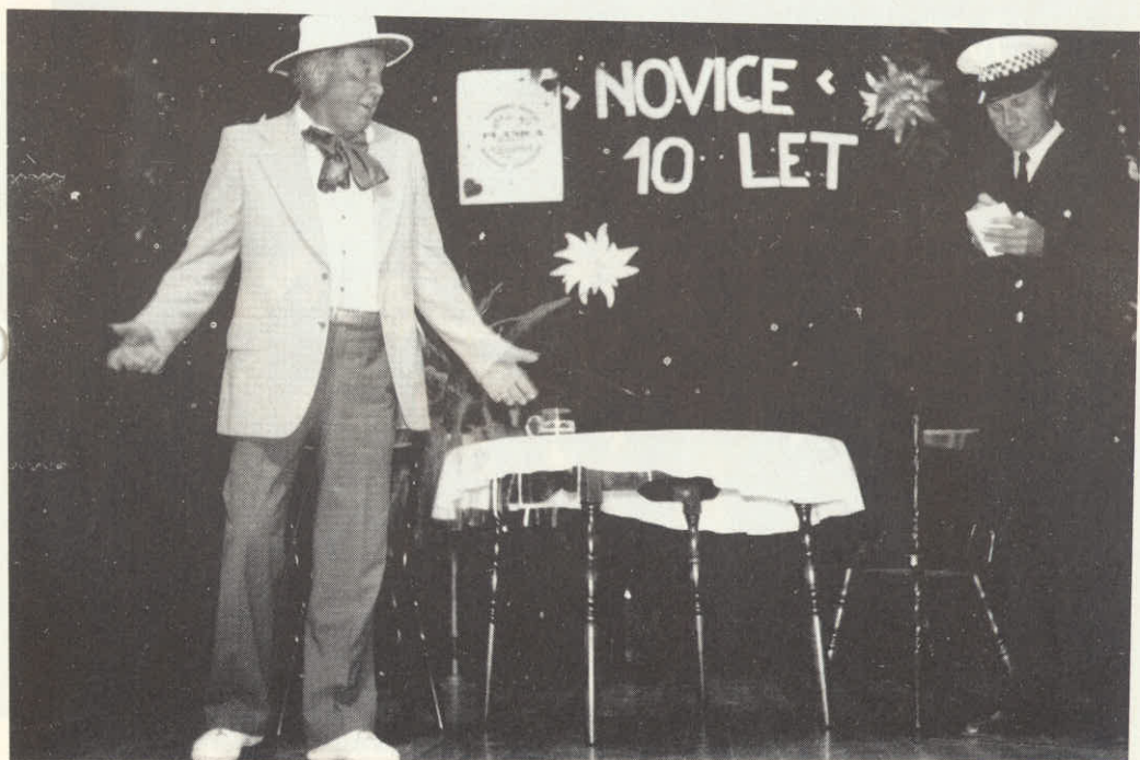
Košir in Tof-(Z.Penko in F.Toplak)