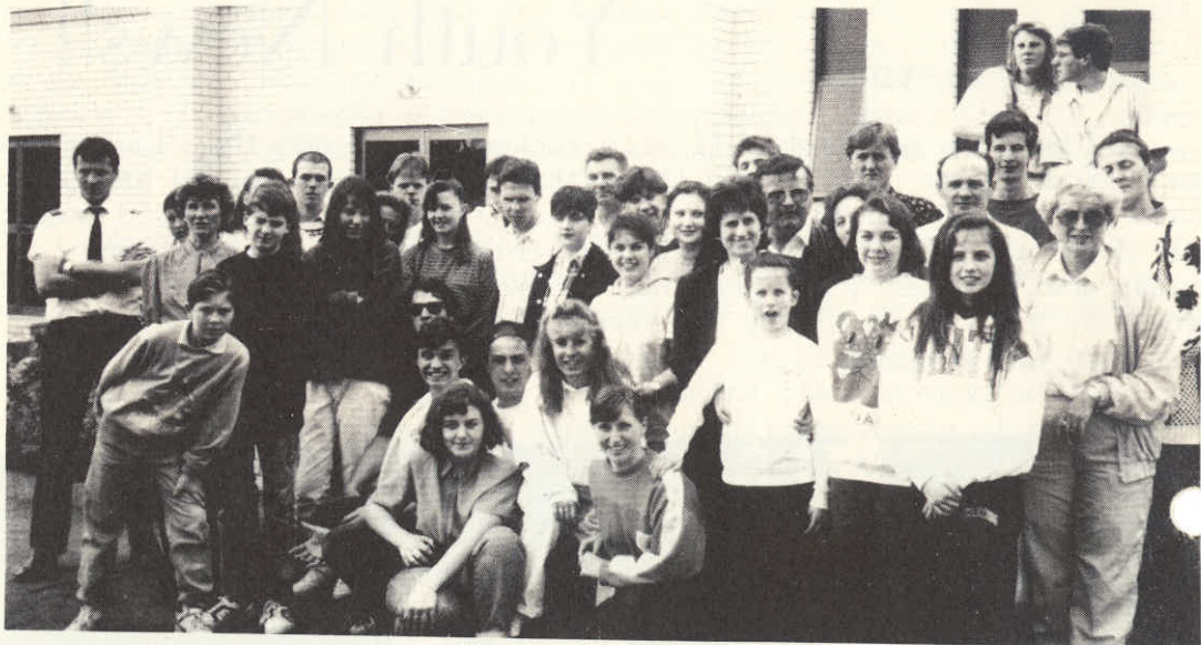
V Sidneju na mladinskem koncertu.