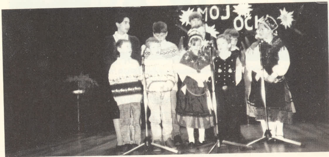
Učenci slov. šole