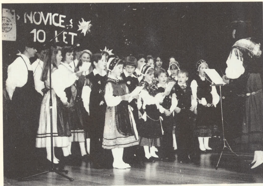
Mladinski pevski zbor Planice.