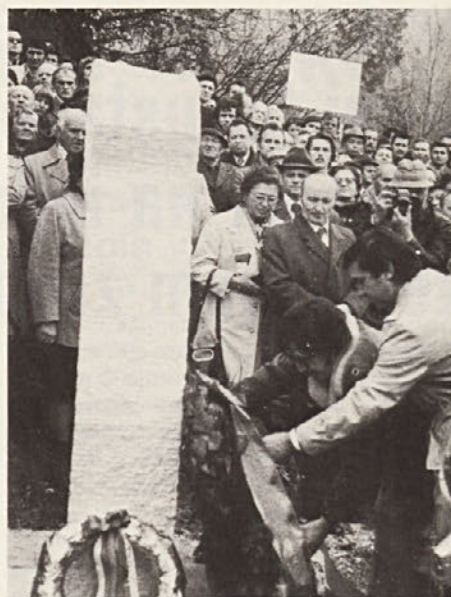
Novo spominsko obeležje na Robežu. Prejšnje obeležje na istem mestu so neonacisti razstrelili

Avstrijske politične sile, ki nosijo odgovornost za povojni razvoj Avstrije, niso samo pokazale slabost in nedejavnost, pred rušilnim delovanjem prebujajočega se neonacizma, pač pa so bile same, ena bolj, druga manj, v večjem ali manjšem delu svojega političnega organizma, prepojene z enakimi ali podobnimi nacionalističnimi idejami in smotri. Prav zato so vse povojne vlade ali ostajale nedejavne ali pa so dobrohotno dopuščale ne le izigravanje sedmega člena, pač pa očitno kršenje še vseh drugih bistvenih določil državne pogodbe. Odkod sicer dopuščanje rovarjenja in natolcevanja proti neuvrščeni Jugoslaviji kot članici Združenih narodov, kar državna pogodba prepoveduje? Odkod nemoteno in nekaznovano rušenje in skrunitev partizanskih spomenikov, se pravi spomenikov pripadnikov protifašističnih sil, kar državna pogodba prav tako prepoveduje in celo nalaga Avstriji dolžnost, vse te spomenike varovati in ohranjati. Odkod dopuščanje očitnih pohleptov po delih ozemlja sosedne države, kot ga neprikrito izraža znani spomenik "izgubljenim" avstrijskim mestom Mariboru, Ptuj, Celju, Brežicam, ki še danes stoji v Gradcu. Odkod dopuščanje, da se na Koroškem in drugod pri belem dnevu pojavljajo na sprevodih in nacionalističnih manifestacijah pripadniki hitlerjevskih nacističnih odredov, kar bi bila Avstrija po državni pogodbi že od vsega začetka dolžna onemogočiti.