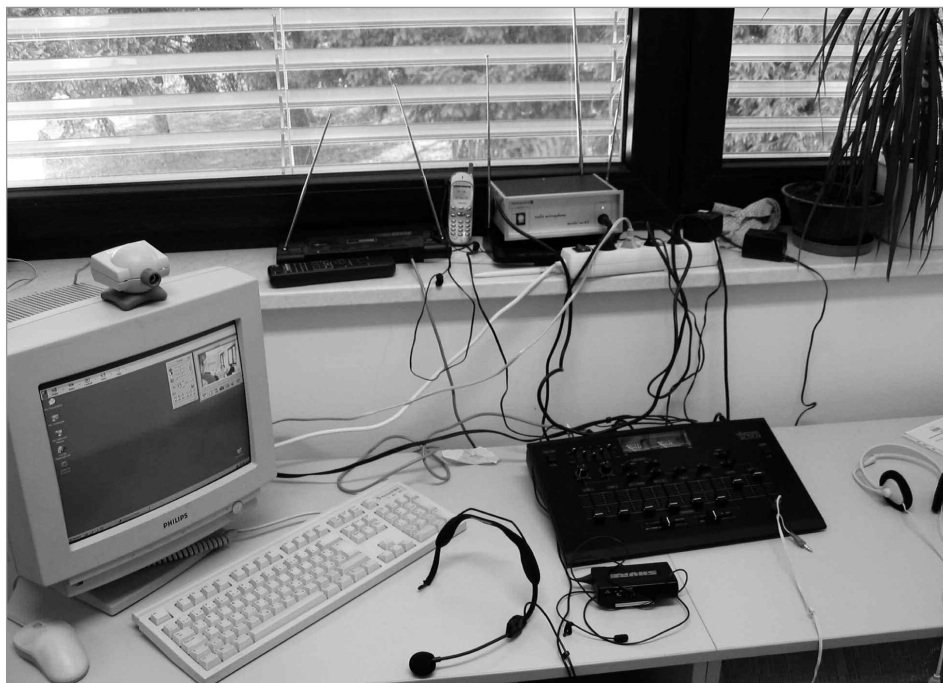
Slika 2: Videokonferenčna oprema

Na začetku smo lahko vzpostavili zvezo s hitrostjo 768 kbps, kar je zagotavljalo dovolj dober prenos, a je kasneje, zaradi dinamike internetnega omrežja, prenos padel na 256 kbps, kar je bilo še ravno na meji zadovoljivosti. Razred smo zvočno pokrivali s tremi mikrofoni, kjer je eden snemal študenta predavatelja, dva pa sta bila usmerjena k učencem. Čeprav smo včasih pri videoprenosu dobili zrnato sliko, smo lahko ugotovili drugačno obnašanje učencev.