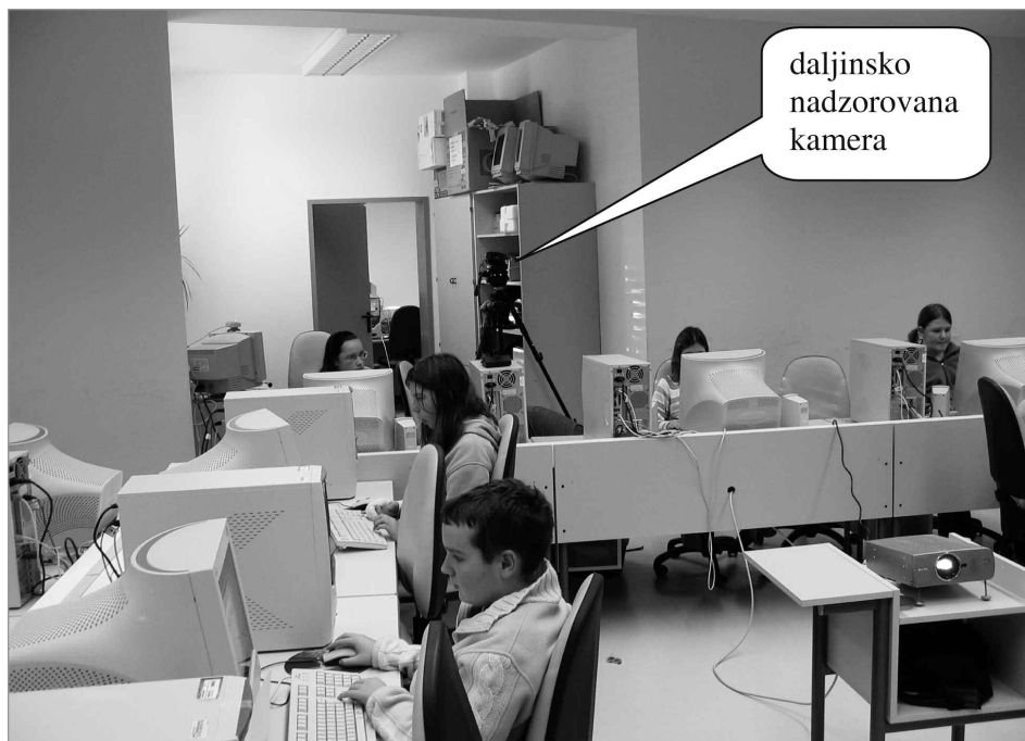
Slika 1: Postavitev kamere v razredu

Preizkus je bil opravljen v računalniški učilnici, ki je imela vso potrebno opremo. Učna ura je bila ura učenja obdelave besedil, nadzornik nad videokonferenčnim sistemom je bil v kabinetu, ki je ločen od učilnice, in je na daljavo usmerjal kamero, ki je bila edini motilni element v razredu (sliki 1 in 2).