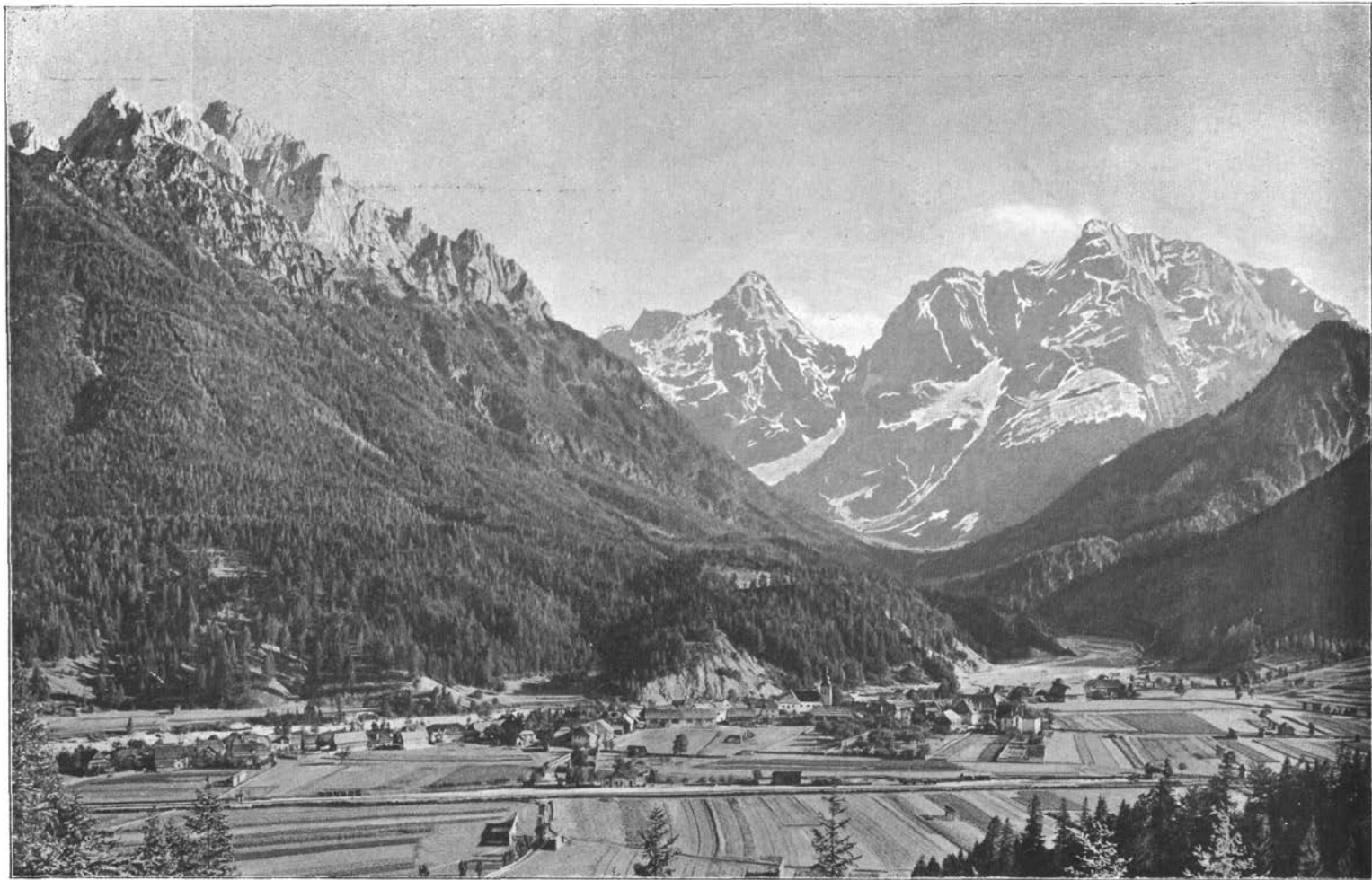
Kranjskagora z južnim planinskim ozadjem.