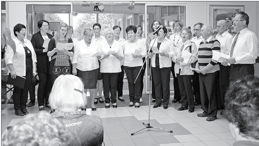
Pevci so poleg ostalih zapeli tudi pesem Marija Nazaret.

Sredi maja, meseca rož in ljubezni, so stanovalce centra starejših v Gornjem Gradu z obiskom razveselili člani mešanega pevskega zbora nazarskega društva sv. Martina. S prepevanjem slovenskih narodnih in ljudskih pesmi ter prebiranjem poezije, tudi izpod peres dveh članov zbora, so stanovalce vrnili v mladost. Številne pesmi so poslušalcem segle do srca, predvsem tiste, ki so jih spremljale skozi življenje.