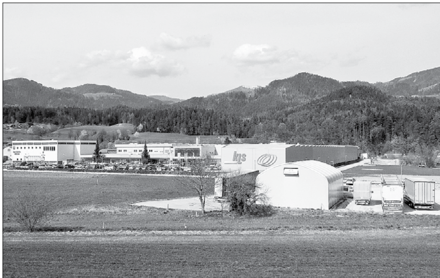
V Zgornji Savinjski dolini so največ čistega dobička, to je nekaj več kot 16 milijonov evrov, ustvarili gospodarski subjekti s sedežem v občini Ljubno.

ustvarili gospodarski subjekti, ki sodijo v občini Ljubno. To je glede na predhodno leto 20-odstotna rast. Ljubensko gospodarstvo je zmanjšalo skupno čisto izgubo glede na leto 2014 za