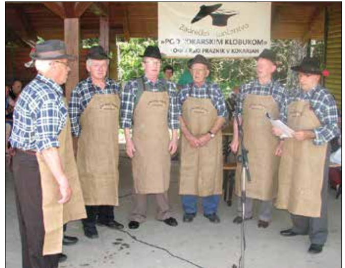
Muzej Vrbovec je poskrbel za stojnice s pestrim izborom izdelkov iz lončenine in ostalih naravnih materialov.

21. maja so športniki pripravili košarkaški maraton za pokal zadrečkega lončarja. Krajevna skupnost Kokarje pa je v sodelovanju z OŠ Nazarje že aprila pripravila lončarsko delavnico za otroke in od-