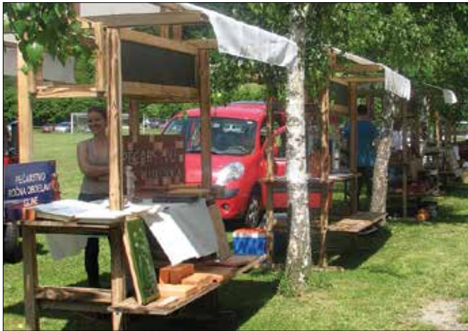
Pevci »veterani« so zapeli pesem o delu kokarskih lončarjev.

rasle. Nastale izdelke so s pomočjo tabornikov Roda Sotočje Nazarje-Kokarje in Turističnega društva Nazarje razstavili na stojnici na sami prireditvi.