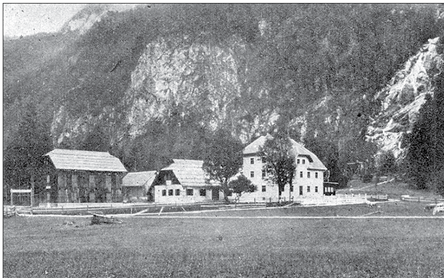
Planinski dom v Logarski dolini s Tillerjevo kočjo. Fotografirano okoli leta 1930.