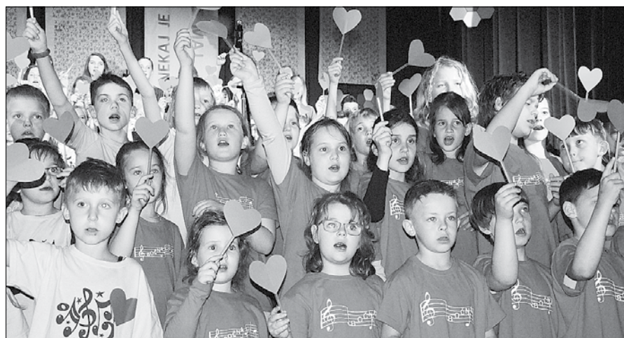
Pesem o sanjah je zadonela po dvorani, saj so se pri prepevanju združili vsi nastopajoči.

ranih glasov pevskih zborov, skupin iz vrtca in posameznikov, plesalcev, igralcev ter zveneči zvoki glasbil, na katera so zaigrali učenci, ki obiskujejo Glasbeno šolo Nazarje, so potrdili besede pesnika Toneta Pavčka. V zraku je bila sreča, ljubezen in veselje.