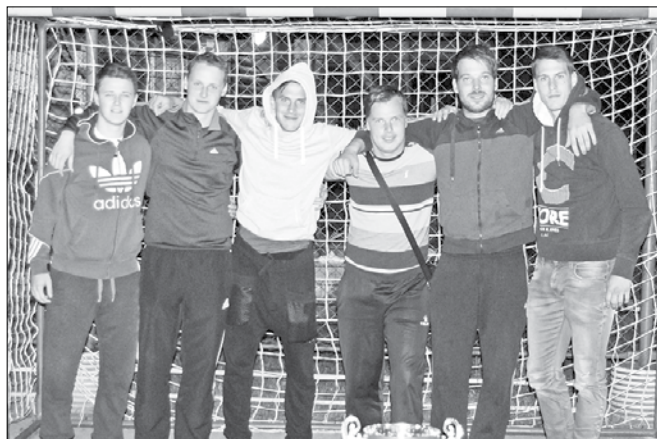
Zmagovalci ekipe Strmi iz Solčave

Ekipe, razdeljene v dve skupini, so pokazale veliko borbenosti in lepih akcij. V prvem polfinalu so igralci ekipe Strmi iz Solčave premagali Ljubence s 6:2. Bolj napeto je bilo v drugem polfinalnem boju, kjer je bil zmagovalec znan šele po izvajanju kazenskih strelav. ŠD Raduha Luče in Podvolovljek sta namreč v rednem