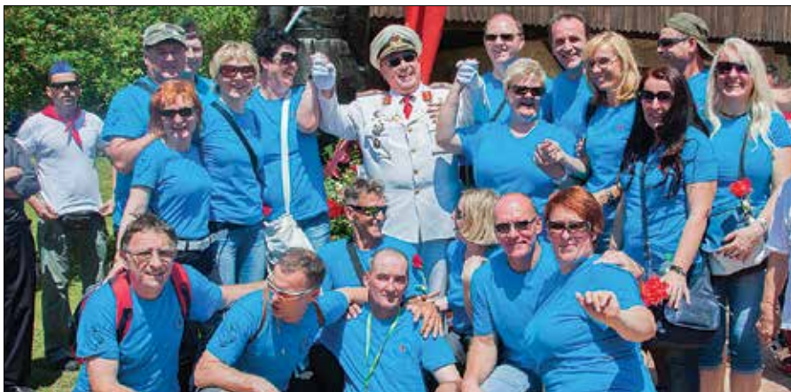
Šmarškim »mladincem« je bilo v Kumrovcu tako zabavno, da so se na licu mesta odločili, da se naslednje leto podajo naravnost v Beograd.