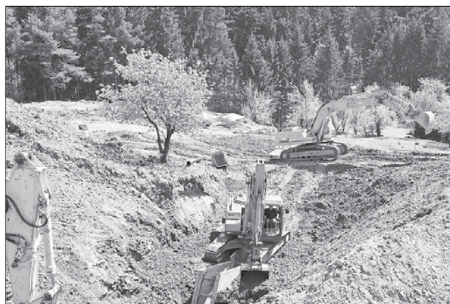
Dela na sanaciji plazu pri Čremešniku

V maju je Javno podjetje Komunala Mozirje izvedlo sekundarni vodovod za del naselja Homec. Vrednost gradnje in priključitev novih uporabnikov na javno omrežje sta