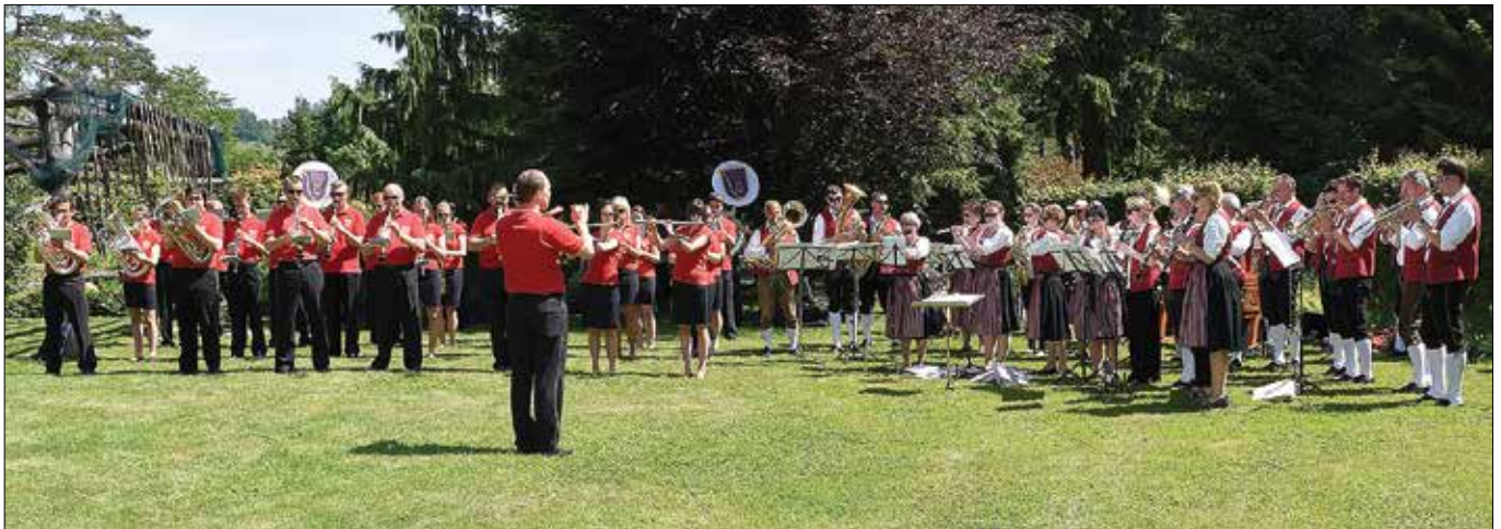
V Mozirskem gaju so s plemenitim namenom združili moči godbeniki Zgornje Savinjske doline in »Frohsinn« Oggenhausen iz Nemčije.