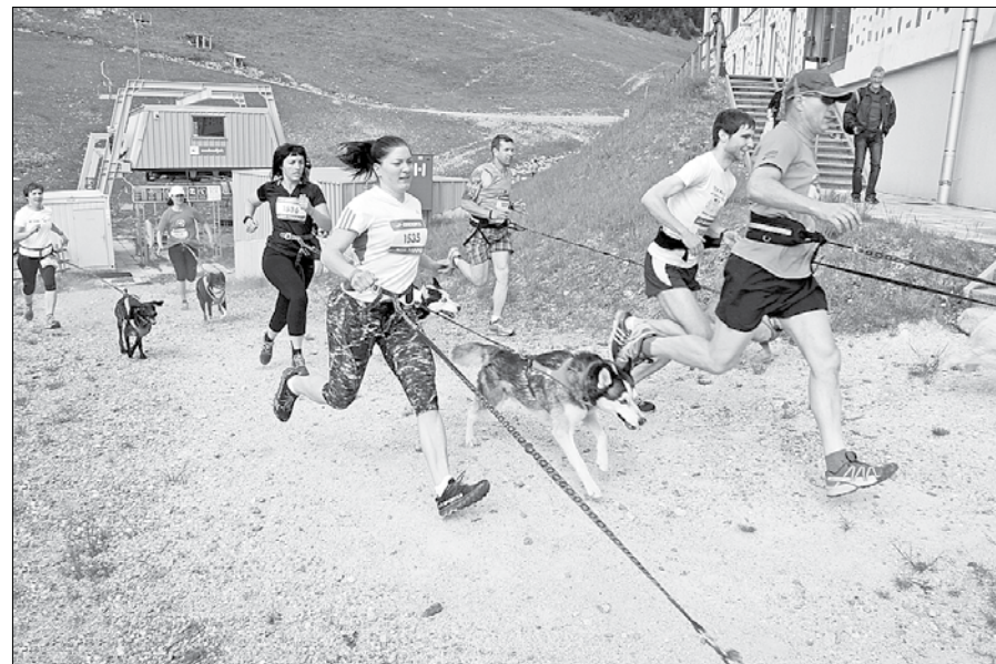
Na trailu Golte je bil tokrat prvič izveden tek za vodnike psov.

če. 29 tekačev, med njimi tudi štiri dekleta, se je po štartnem pisku hitro podalo v hrib in po makadamski cesti preteklo prvih 500 metrov. Nato so se odcepili desno in po gozdni poti strmo navkreber. Trasa je bila večinoma speljana po senci, po planinski poti na Mozirsko kočo. V dol-