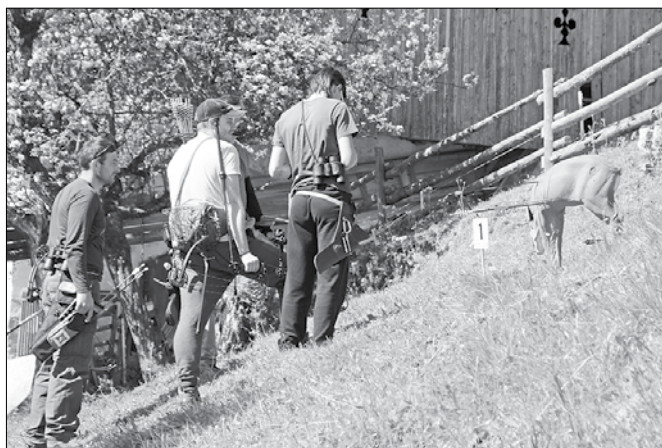
Tarče v naravni velikosti so bile razporejene po celotni poti.