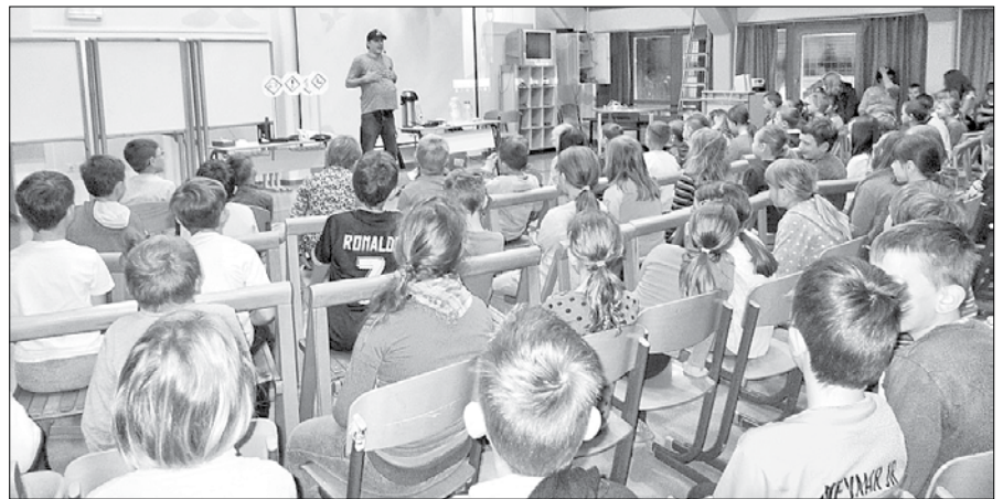
Učenci OŠ Rečica ob Savinji so si ogledali izobraževalni predstavi.

Ministrstvo za delo, družino, socialne zadeve in enake možnosti si prizadeva za uvajanje varnosti in zdravja pri delu v vzgojo in izobraževanje, s ciljem dvigniti varnostno kulturo mladih. Splošno znano je, da tisti, ki so se v otroštvu naučili določenih pravil varnega ravnanja, posvečajo večjo pozornost varnosti in zdravju pri delu tudi kasneje, ko se zaposlijo. S tem namenom ministrstvo organizira vrsto aktivnosti, med katerimi so tudi izobraževalne predstave.