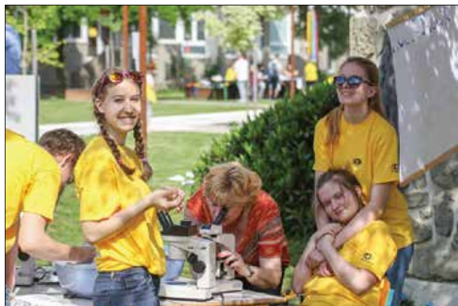
Gimnazijci in njihovi mentorji so na prostem prikazali nekaj zanimivih raziskovalnih projektov.

TELOVADBA PO METODI FELDENKRAUS V NAZARJAH