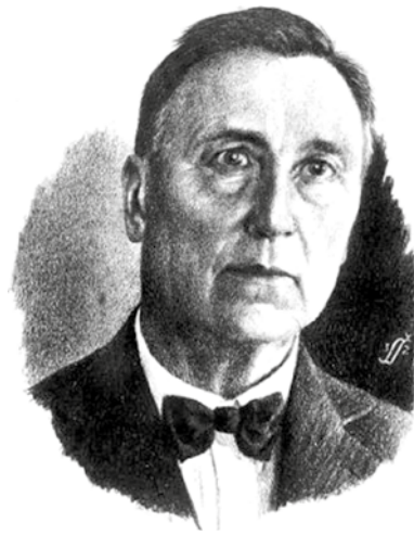
Josip Pavčič (1870–1949), slovenski skladatelj.

Šola obsega skupno okrog 155 strani, zajema pa zelo širok razpon težavnostne stopnje – od začetniške pa celo nekje do nivoja 6. ali 7. razreda v današnjem sistemu nižjih glasbenih šol. Dosegljiva je na portalu dLib (Digitalna knjižnica Slovenije).