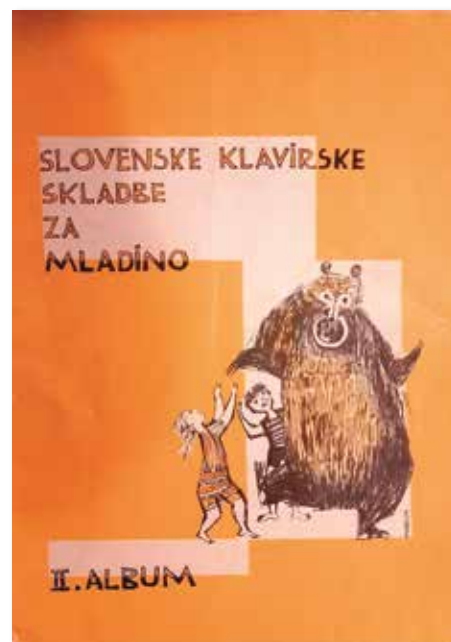
Naslovnica zbirke Slovenske klavirske skladbe za mladino

Pavčič je napisal tudi zanimiv članek O klavirju in klavirskem igranju (izšel leta 1927 v reviji Življenje in svet ), v katerem piše o tem, kdaj naj se otrok začne učiti igranja na klavir, kakšno je sistematično učenje, kaj je potrebno za napredovanje in tudi kako skrbeti za inštrument. Članek je dosegljiv na portalu dLib.si (digitalna knjižnica Slovenije; revija Življenje in svet , letnik 1, leto 1927, št. 40, strani 923–925).