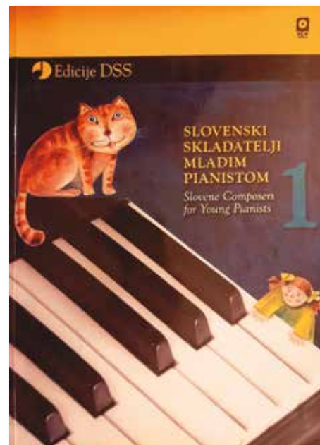
Naslovnica zbirke Slovenski skladatelji mladim pianistom 1