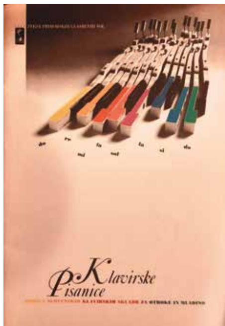
Naslovnica zbirke Klavirske pisanice