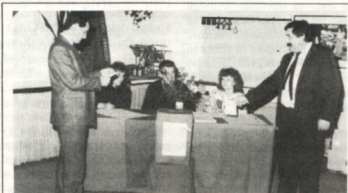
VOLITVE – 10. marca so bile volitve v samoupravne organe delovne organizacije Beti. Naš posnetek je iz TOZD metraže, kjer so volišče primerno okrasili, a tudi člani volilne komisije so se »vrgli« v praznje obleke. Tako je tudi prav: navsezadje pa volitve le niso vsak dan.