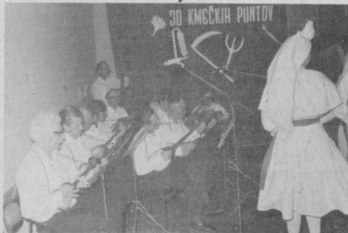
Posnetek s prireditve ob 8. maju — krajevnem prazniku.