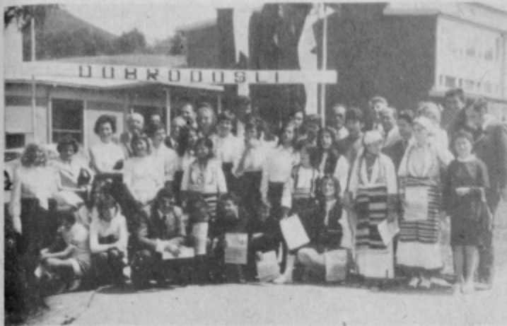
Mladi gostje in gostitelji pred osnovno šolo v Podlehniku.

Ob dnevu mladosti je bilo v osnovni šoli Martin Kores v Podlehniku prvo srečanje učencev in učiteljev iz po ene šole iz vseh republik. Posamezne republike so zastopale naslednje osnovne šole: „Slavko Rodić“ iz Drvarja — BiH, „Bajo Jojić“ iz Andrijevice — Crna gora, „Ivan Murkovič“ iz Vinice — Hrvatska, „11. noemvri“ iz Slivovskih Anovi — Makedonija, „Radoje Radojičić“ iz Ugrinovcev — Srbija in osnovna šola „Martin Kores“ iz Podlehnika.