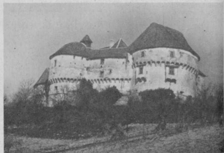
Veliki tabor iz 16. stoletja