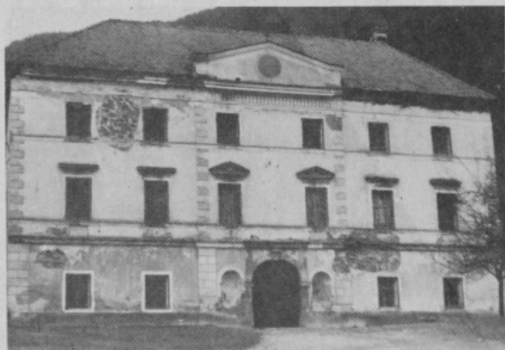
Vhod v razpadajoči Studeniški samostan

Zanimive arhive iz preteklih obdobij tega področja in ostale premičnjine vestno čuva krajevni župnik. Vas je imela svoje gledališče. Vodovod dela še danes, vodarino pa pobira vodna skupnost Bistrica, kljub temu, da so si ga zgradili vaščani sami in ko še Bistrica ni imela vodovodnega omrežja. Kljub temu, da se v Studenicah pobira vodarina za nekaj, za kar pobiralec sam sploh ničesar ni prispeval, se dogaja tudi to, da danes zaradi velikega odjema vode (kopalnice, pralni stroji, stranišča in večja gospodinjstva) pade vodni pritisk v ceveh iz predvojnih časov na minimalo in voda v marsikateri hiši ob kritičnih urah potrošnje sploh ne teče. V takšnih primerih pa se vodna skupnost, ki pobira vodarino, ne spomni, da je dolžna uporabniku zagotoviti stalni pritisk in količino vode, razen takrat, ko je morda vodovod v