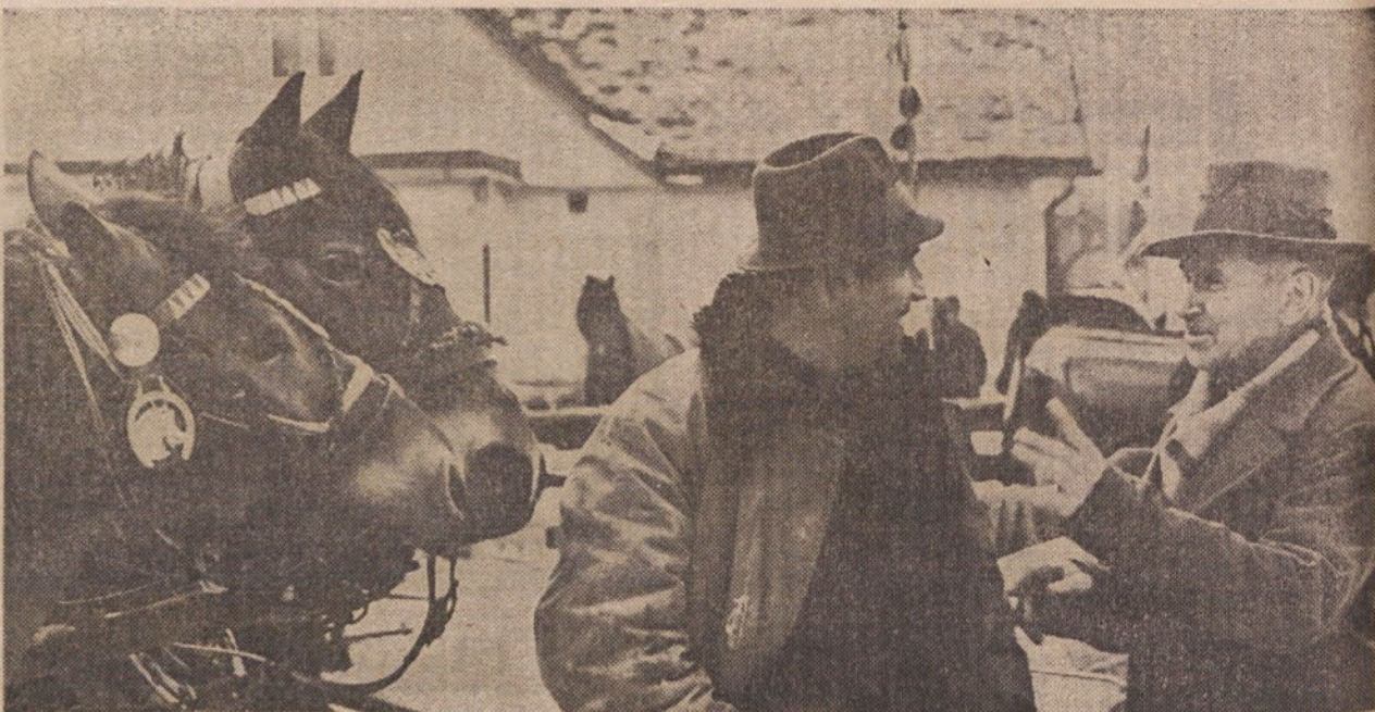
Po sejmu na Črnučah

In tako dalje. Vprašanje brezposelnih in problem, ki nastaja v tej zvezi, se torej uspešno premikajo v bolj optimistični smeri.