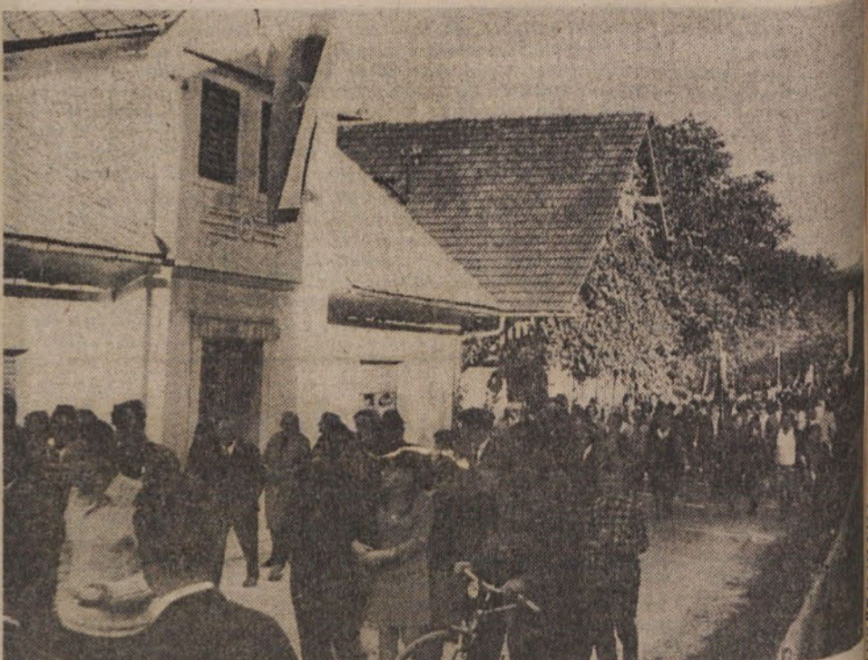
Na cesti v Bočni se je zbrala vsa vas