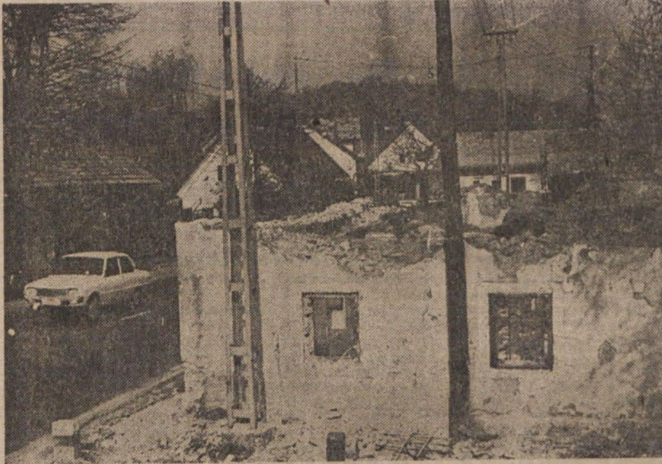
Zdaj še teh zidov ni več — Ob rekonstrukciji Titove ceste na Ježici se je morala umakniti tudi Hromčeva hiša pred gostilno Angelca