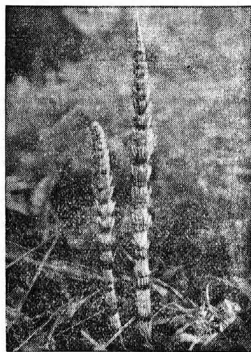
Ogromna preslica, ki raste v Srednji Evropi, je eden redkih primerov tistih preslic, iz katerih se je tudi tvoril premog.

Tako je šlo dan za dnem. Eno uro smo se sprehajali, eno uro smo prebili v obednici,