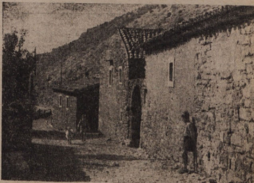
Motiv iz Bazovice.

Počasi se je Petja vrnila pred hišo in sedla na prag. Zamišljeno je gledala v pomarančne olupke pred seboj. Stisnila se je k vratom in si s krilcem pokrila boste noge... S. M.