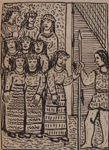
Kresnice in Dragožit

Spacalove risbe izpopolnjujejo povest in so v skladu s primirnim miljenjem starostovanskega življenja na Primorskem. O njih lahko rečemo, da niso samo ilustrir-