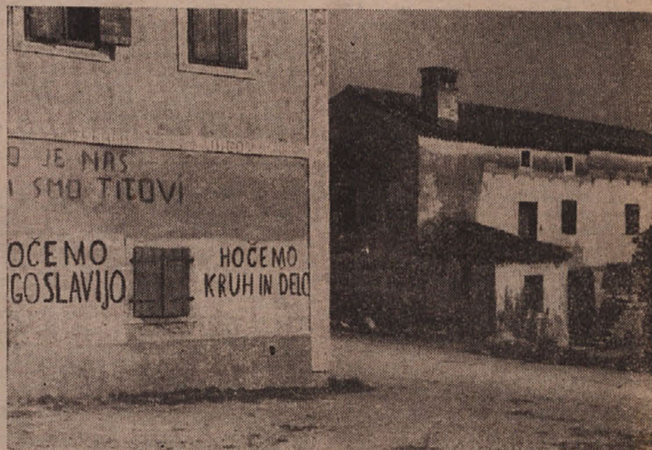
Vse ljudstvo Julijske Krajine hoče Jugoslavijo. Ta posnetek je bil napravljen v Brdih. Še na tisoče takih posnetkov bi lahko prinesli. Vsaj zidovi naših hiš kričijo po Jugoslaviji. Na mnogih krajih pa, kjer so bili napisi, so bele lise, ki pričajo, da so na delu sile, ki nečejo, da bi ljudska volja prišla do izraza.