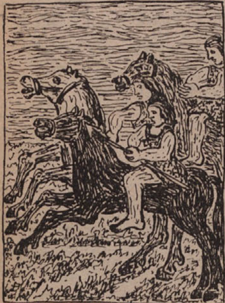
ziznec, Vrljug in Dragožit jezdijo na pomoč

tem, da bi njegovo plemo posedlo svoje prvotno ozemlje. Ob napadu Vlahov na Gradišče ubije Dragožit Palonovega očeta, njegova samega pa pridrži kot talca. Palon in Božan gresta z Gradišča, da se pripravita za blagovestnika.