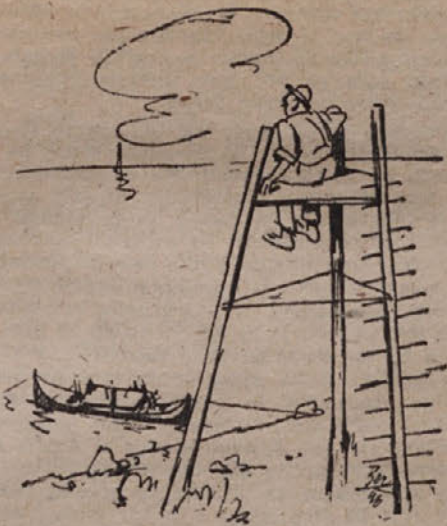
»Kolnar« na Karuni opazuje tune.

Najbolj živahen, najbolj razburljiv, a obenem najbolj romantičen je lov na tune. Ta se vrši navadno od avgusta do oktobra. Posebno, če ribe »hodijo kot muhe« vlad