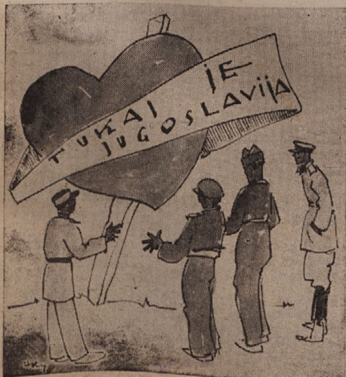
KADAR PRIDE KOMISIJA V JULIJSKO KRAJINO

Vzroki, da število slovenskih dijakov ni v pravem razmerju s številom slovenskega prebivalstva, so naslednji: 1. Mnogo slovenskih dijakov obiskuje še Italijanske srednje šole, ker Slovenci še nimamo vseh tipov slovenskih šol; 2. nekateri se zaradi pomanjkljivega znanja slovenskega jezika niso upali prestopiti v slovensko višjo srednjo šolo; 3. večina slovenskih dijakov biva po vaseh, ki so precej oddaljene od mest, kjer je slovenska srednja šola; v mestih pa je fašizem slovenski življenj močnejše razna-