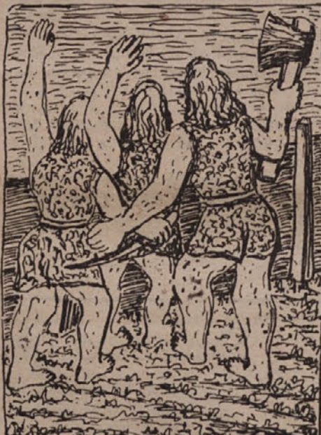
Mozje gredo na boj

dišče svojega očeta ter se bori proti vsem tistim, ki hočejo spraviti Gradišče v bavarsko odvisnost. Božan je posredujoča sila med Dragožitom in Palonom ter zagovarja krščanstvo. Palon je krščenik ter leži za