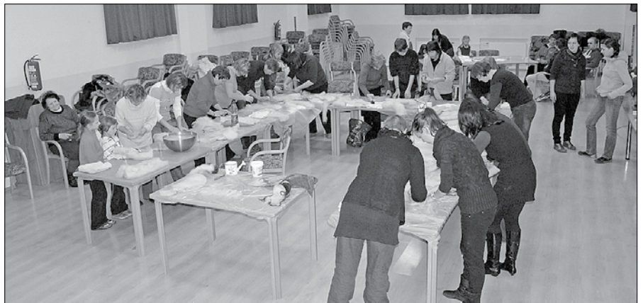
Filcarke so se lotile izdelovanja tople zimske kape.

Zadnji torek in sredo v preteklem letu sta se v organizaciji Turističnega društva Luče in s pomočjo TIC-a odvijali praznični delavnice ročnih del in filcanja. V torek so članice lučkega ročnodelskega krožka na ogled postavile izdelke, v katere je vtkano veliko veselja do ročnih del. Pleteni, vezeni in kvačkani izdelki, mojstrovine v rišeljeh tehniki ter še kaj je našlo mesto v lučki dvorani kulturnega doma. Obiskovalcem so bile predstavljene posamezne tehnike izdelovanja ročnih del. Med številnimi izdelki so izstopali praznični motivi na prtih in kvačkani obeski za božična drevesca.