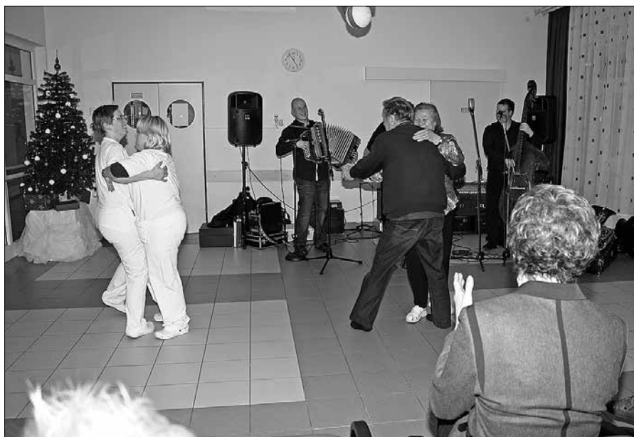
Ob živahnih zvokih ansambla Labodi so se nekateri tudi zavrteli