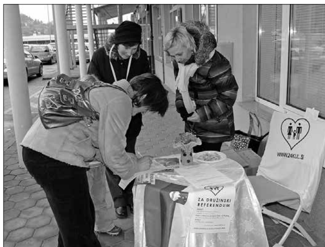
V samo enem dnevu je podpis za referendum pred upravnim centrom v Mozirju oddalo 132 ljudi.

podprli v Novi Sloveniji, Slovenski ljudski stranki in Slovenski demokrati stranki. Po mnenju SLS zakonik posega v temelje naše družbe in ruši temeljni pomen zakonske zveze, ki je v zasnovanju družine.