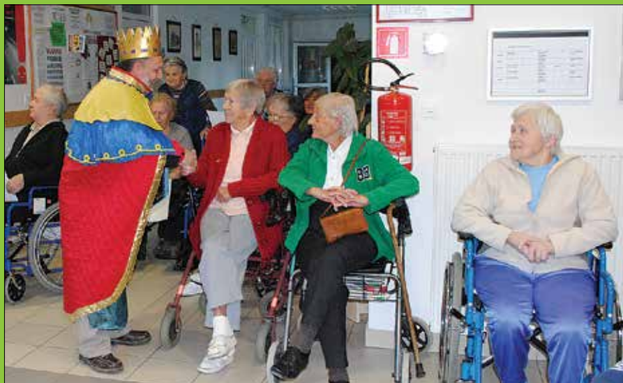
S pesmijo in iskrenim voščilom so koledniki polepšali dan varovancem centra starejših v Gornjem Gradu.

Domačini so jih na svojih domovih in v teh prazničnih dneh toplo sprejeli, le redka vrata so ostala zaprta. Sproščenost mladih kolednikov in njihova pripravljenost, da svoj prosti čas darujejo za srečo drugih, je prepričala ljudi, da so