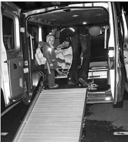
Za prilagoditev vozila lahko gibalno ovirani invalidi ali njihovi skrbniki zaprosijo za sofinanciranje stroškov.

Nov ukrep je vzpostavitev klicnega centra za