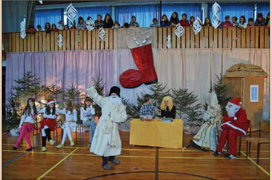
Vsi trije decembrski možje so obiskali šolarje v Gornjem Gradu.