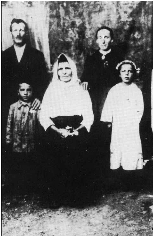
Birma pri Dražniku na Dragi leta 1928

so tej hrani rekli prefand. Običajno so hrano dostavljali na planino tedensko. Seveda je bilo točno določeno, kaj vse mora biti med hrano za pastirje in koliko. Zanimivo, tudi tobak so dostavljali na planino. Denarja običajno pastirji niso dobili, pač pa so imeli pravico prepasti kakšno žival in jo potem prodati. Dali pa so pastirju tudi gvant in ubujo (punčhe). Pozimi so delali z ovcami v hlevu, hranili so jih s senom. Pogosto so s pastirji ravnali slabo, zato se je večkrat zgodilo, da je kateri od njih pobegnil od kmeta. Na pla-