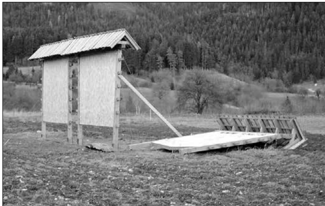
Med »žrtvami« hudega vetra je bil tudi reklamni kozolec na Ljubnem ob Savinji.

Močan veter je v noči s petka na soboto največ težav povzročil odjemalcem elektrike, saj je bilo veliko gospodinjstev po Zgornji Savinjski dolini lep čas brez nje. Veter je podrli številna drevesa in pometal kar nekaj opeke s streh.