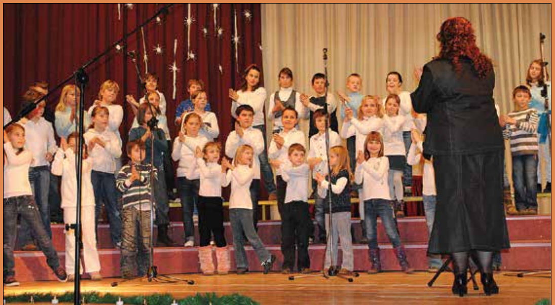
Najmlajši nazarski pevci so nastop obogatili s koreografijo.