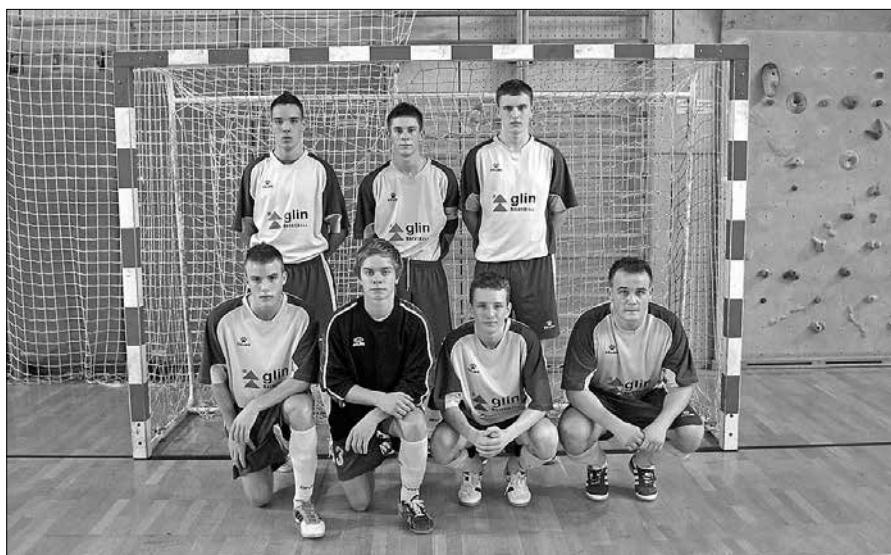
Mladi Nazarčani so se dobro upirali favoriziranemu Dobovcu.