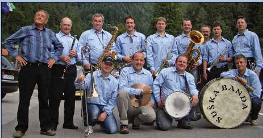
Večina članov glasbene skupine prihaja iz okolice Rečice ob Savinji in Dol-Suhe, od koder izvira ime »Suška«.

Repertoar Suške bande sega predvsem na področje narodne in ljudske glasbe, občasno radi zapljujejo tudi v kakšne modernejšje glasbene vode. Zase sicer pravijo, da je njihova prvenstvena naloga izpopolnjevati svoje glasbeno znanje in zabavati ljudi, zato nastopajo predvsem na dobredelnih koncertih, raznih otvoritvah in prslavah ali kot gostje na koncertih svojih glasbenih kolegov, vsako leto pa organizirajo tudi samostojni koncert, ki je vedno začinjen z obilico raznovrstne glasbe in humorja.