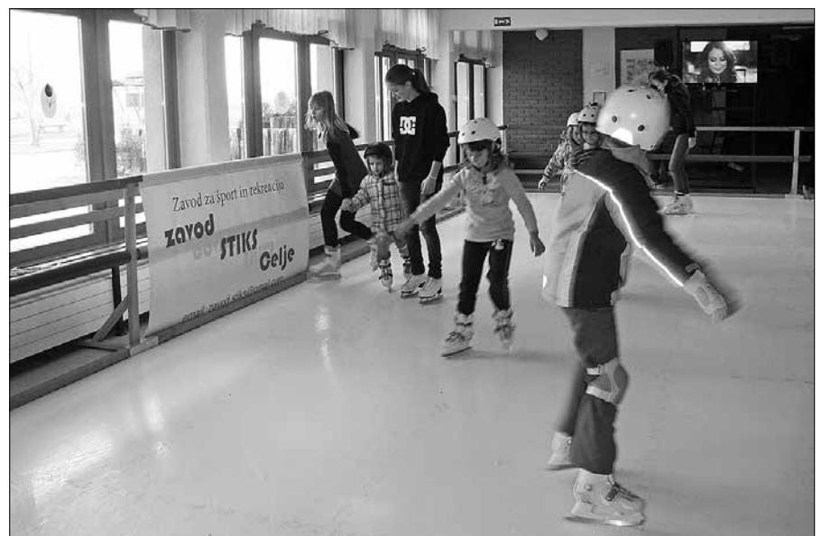
Drsališče s sintetičnim ledom je privabilo veliko število ljubiteljev drsanja.