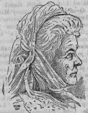
Königin Elisabeth von Rumänien Carmen Sylva.

Kraljica vdova Elizabeta rumunska, znana s pisateljskim imenom Carmen Sylva je te dni umrla. Bila je 29. decembra 1843 na gradu Monrepos pri Neuwiedu kot hčerka kneza Hermannna za Wied-Neuwied rojena. Dne 15. no-