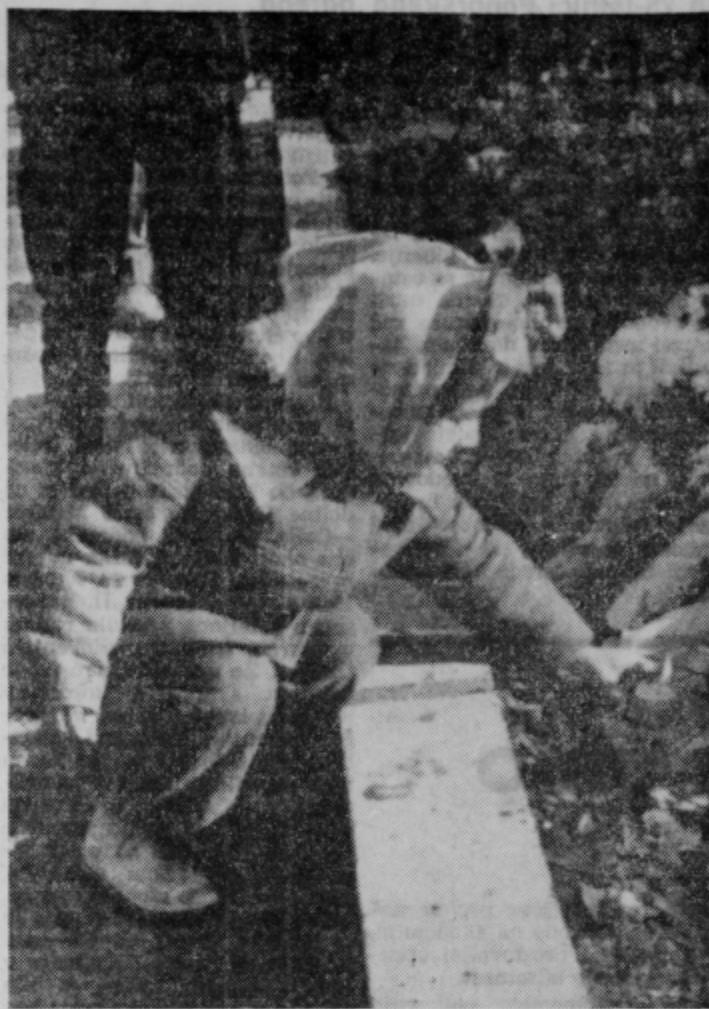
Se drobna lučka iz male roke v spomin umrlim...

Na koncu je bilo ugotovljeno, da pri teh vprašanjih gre verjetno za nekatere napake, ki se sedaj potencirano pripisujejo integraciji. Tem napakam pa se je v bodoče izogibati, ker le to lahko samo škodujejo ne pa koristijo. Toš