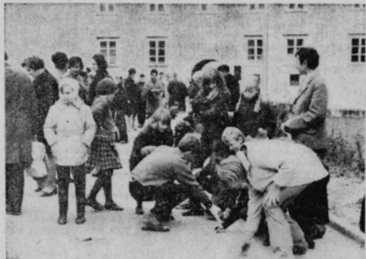
Mladi risarji pri delu

Pri nas doma je oče obrtnik, mamica je gospodinja in dela na kmetiji. Oba imam zelo rada.