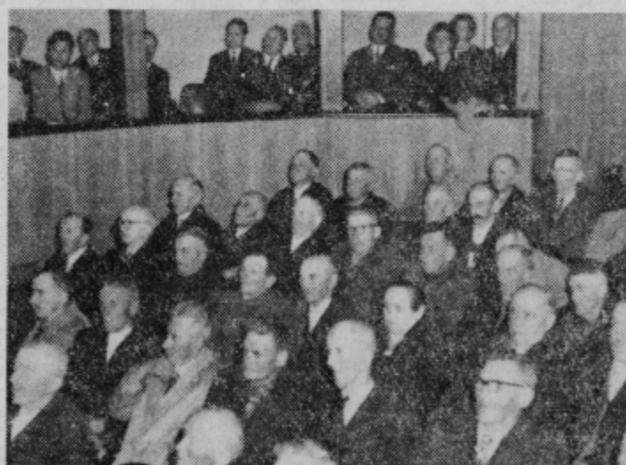
Udeleženci so zasedli gledališko d vorano