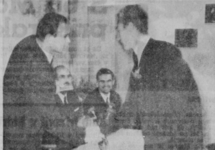
Prisrčni stisk roke ob podelitvi članske izkaznice