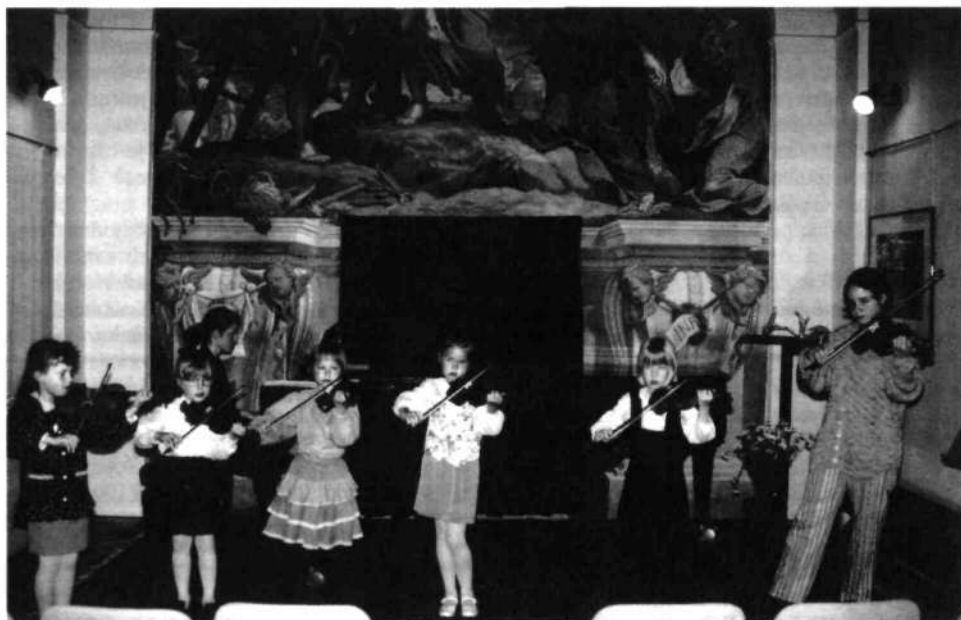
Zaključni nastop violinistov Glasbene šole Škofja Loka 25. maja 1998 v kapeli Puštalskega gradu.