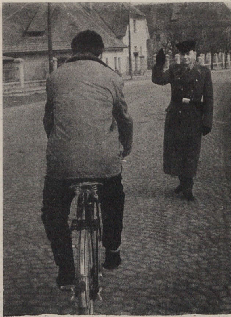
Prometni miličniki imajo največkrat opravka z nediscipliniranimi kolesarji

Deloma so kaznivim dejanjem vzrok tudi neurejene razmere zlasti v samskih domovih oziroma delavskih naseljih, kjer pride zaradi alkohola in hazardiranja