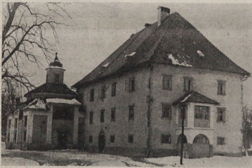
Prehodni mladinski dom v Kodeljevem parku

Tako je strokovnjakom poznan celoten otrokov dosedanj biopsihičen razvoj in ni jim težko ugotoviti, kako je pravzaprav prišlo do sedaj poznanih otrokovih motenj; obenem pa že tudi lahko nasvetujejo vzgojne in prevzgojne ukrepe, ki bi bili za čimprejšnjo in vsestransko otrokovo re-educacijo in resocializacijo najboljše, najhitrejši in najcenejši. O vsem tem izedal zavod posebno zaupno poročilo in ga z izsledki in napotili pošlje organu socialnega skrbstva pristojne občine.