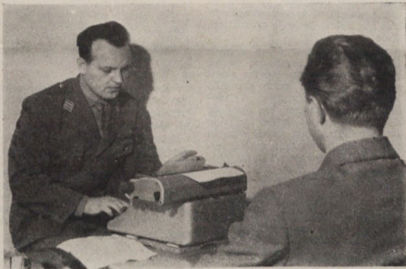
Delo miličnikov je zelo naporno in zahteva vsestransko znanje

Se in še bi lahko govorili o delu in problematiki miličniške službe in o dobrih in slabih lastnostih Moščanov. (Nadalj. na 6. str.)