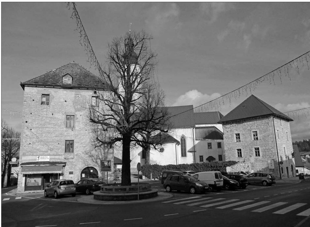
Središče Cerknice z ostanki protiturskega tabora (foto B. Golec, januar 2018).

okolici ni nastal noben pomembnejši grad. Na drugi strani je bila cerkniška hubna vas, ki se prvič omenja že leta 1040 ( in villa Circhinitz ), 11 nesorazmerno velika in je združevala vse prednosti obeh sosedov: leta 1222 je tu izpričana mitnica na patriarhovi cesti 12 in pol stoletja zatem (1265 oz. 1274) sedež precej starejše prazupnije iz druge polovice 10. ali začetka 11. stoletja. 13 Ob oddaljenosti od gosposčinskega sedeža, od prve polovice 13. stoletja pa tudi neugodni bližini trgov Planine in Loža, je ostajala Cerknica še v zgodnji novi vek samo farna vas. V razlikovanje od sosednje Dolenje vasi je zlasti med prebivalci ožjega okoliša veljala za Gorenjo vas (Oberdorf). 14