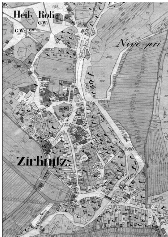
Cerknica na franciscejski katastrski mapi iz leta 1823 (ARS, AS 176, Franciscejski kataster za Kranjsko, A 217, k. o. Cerknica, mapni list V).

Cerknica je po številu hiš tudi v prvi četrtini 19. stoletja ohranjala prvenstvo med trgi zasledovalci,