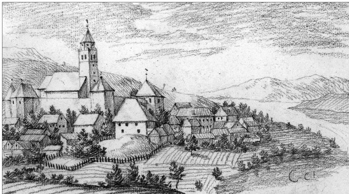
Cerknica po Valvasorjevi skicni knjigi 1678–79 (Valvasor, Topografija Kranjske, št. 34).

rische Bürger, inen den Bürgern ), 39 medtem ko dotlej niti v enem od nemalo ohranjenih virov ni ne trga ne tržanov, temveč zgolj vas, soseska ali posamezniki, imenovani: »iz Cerknice«. 40 Izpodrinjenje vaškega imena s trškim seveda še zdaleč ni bilo hipno, 41 a se je uporaba trškega naslova, prvič izpričanega leta 1632 ( de oppido Cirknice ), povsem utrdila prej kot v pol stoletja. 42