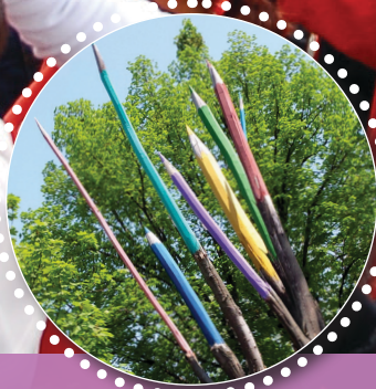
DEŽELA NOTRANJE LEPOTE