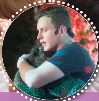
ŽELIMLJE - 25 LET