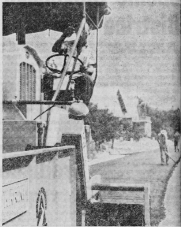
S samoprispevkem smo med drugim asfaltirali že več širih prašnih in jamastih cest

Glede na to, da so samoprispevek sprejeli že v večini krajevnih skupnosti po-