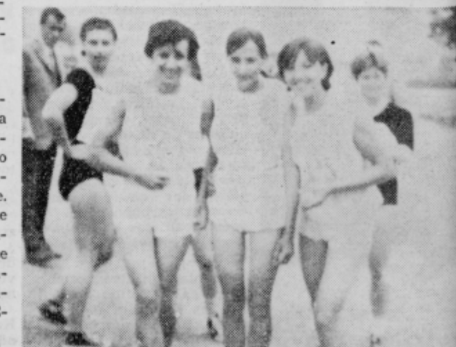
Dekleta iz Markove na enem izmed atletskih tekmovanj