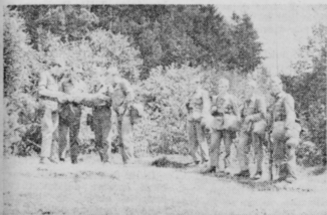
MLADE OBRAMBNE MOČI

Posebno pomembno je delo z mladimi. Na osnovnih