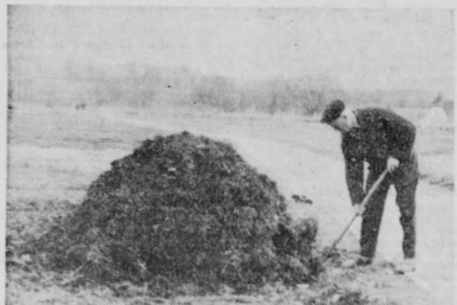
Vrtičkarje je zvabilo prvo sonce

li. Prvo delo je najbolj »zaplenu«. Potrebno je raztrositi gnoj in priznati morate, da je prava sreča, če tistega iz hlevov sploh lahko dobite. Se nekaj dni in ob naseljih se bo vil dim, ki bo