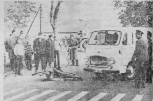
Uslužbenici postaje milice Ptuj pri reševanju ene od številnih prometnih nesreč.

Vzroki prometnih nesreč so bili: neprimerna hitrost 12, izsiljevanje prednosti 67, nepravilno prehitjevanje 65, vrnjenost 62, nepravilna stran-