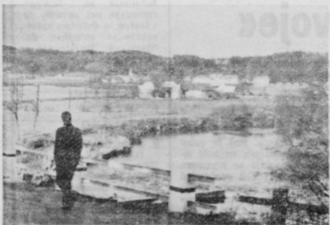
Tudi fanta iz Majšperka je prebudila pomlad. Ozira se proti potoku, ob katerem so spomladi sprehodili najlepši. Verjetno se ne bo sprehajal sam, saj je prišla pomlad.

Zakotne doline in globeli, ki so bile do nedavnega še polne snega, so pobelili zvončki. Popki na drevju se že odpirajo. Še malo sonca in narava se bo odela s cvetjem. ZR