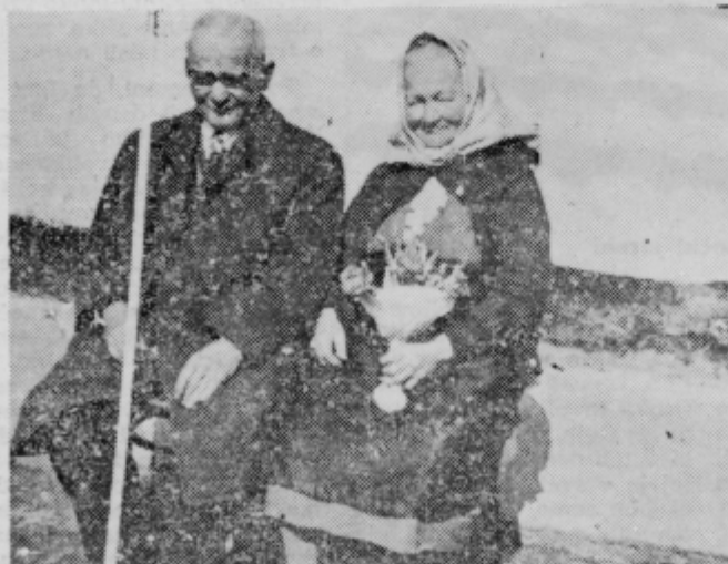
Trenutek oddiha in poziranja fotografu