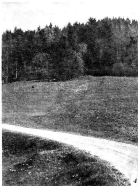
Sledovi nasipa na Trševju

zaznava še dandanes. 3 Tudi Premerstein in Rutar omenjata rimsko utrdbo. 4 J. Ciperle pa istega leta označuje šance na griču med Staro in Novo Oselico kot ostanke gradišča. 5