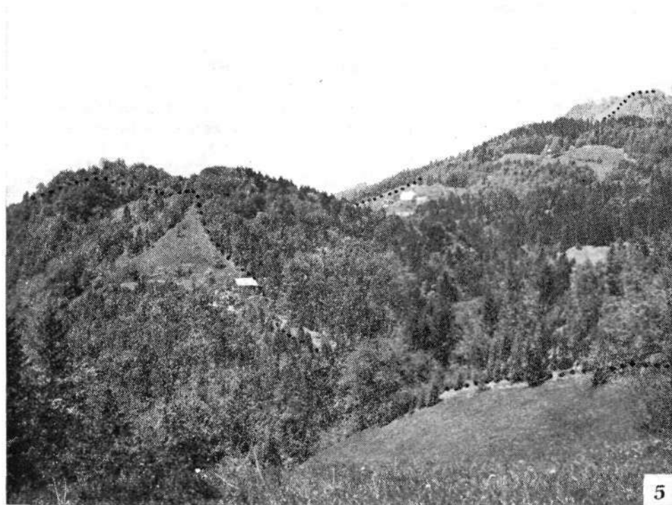
Razvodje južno od Bevkovega vrha: z desne Bevkov vrh, Kaludrovski grič, sedlo nad Lanišarjem, Jaški grič, Znojile in pobočje Na Rupah

Po večkratnem brezuspešnem iskanju ostankov nasipov okrog Nove Oselice in »šanc« so pri ponovnem proučevanju virov o zaporah dale uspešen