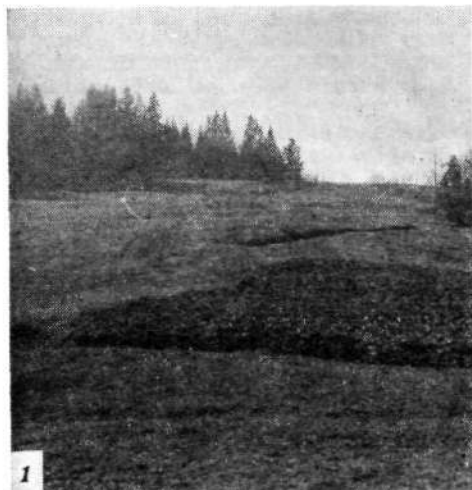
Sledovi nasipa z Vrh Slamovja na Trševje