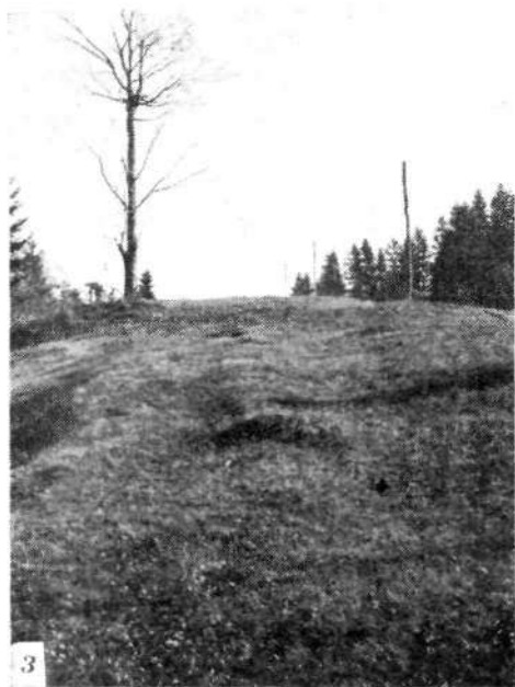
Sledovi nasipa na sedlu pri Veharšah