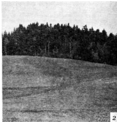
Sledovi nasipa po pobočju Ojkalce pri Slamovju