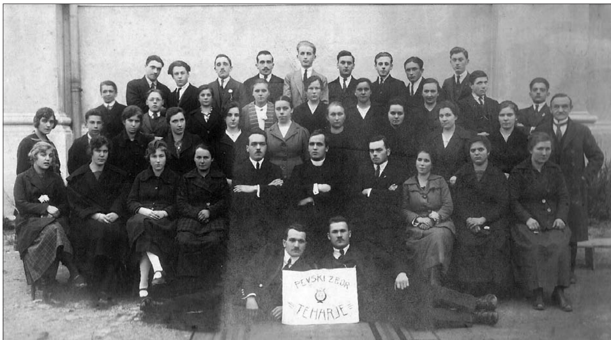
Pevsko društvo Teharje (hrani Železarski muzej Štore).