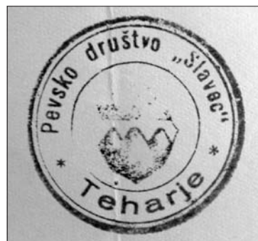
Žig Pevskega društva Slavec Teharje (hrani: SI_PAM/0122, šk. 7, spis 328).