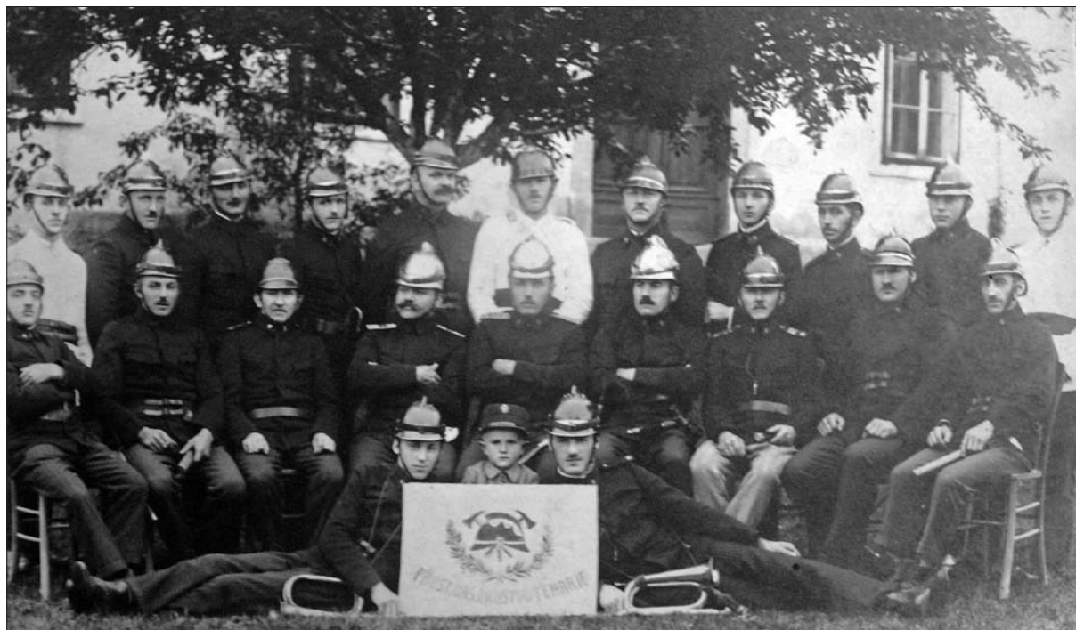
Teharski gasilci leta 1929 (hrani železarski muzej Štore).