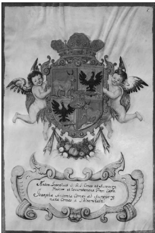
I pisni lisi % grbom Aniona Jozefa .iuerspaga (ARS, AS /073,11/33)