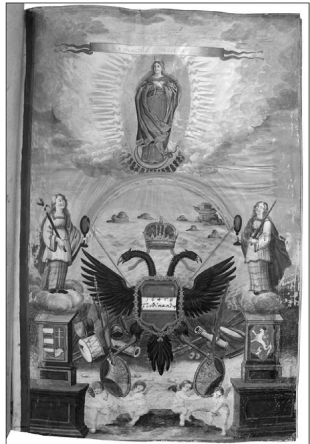
I-pisni list cesarja Ferdinanda III. Brezmadežno kolpatrom Avstrije', 1647-1650 (IRS, \IS 1073, II/52r)