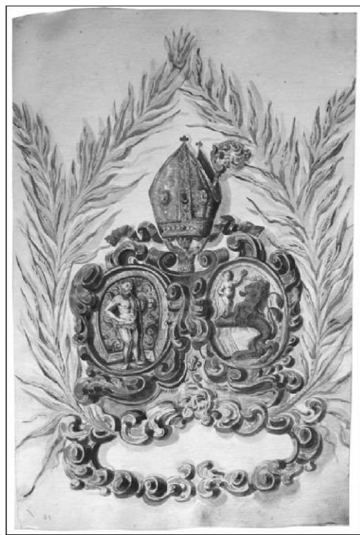
I-pisni list j-grbom kostanjeviskeg opala (AKt, - IS 1073, II/52r)