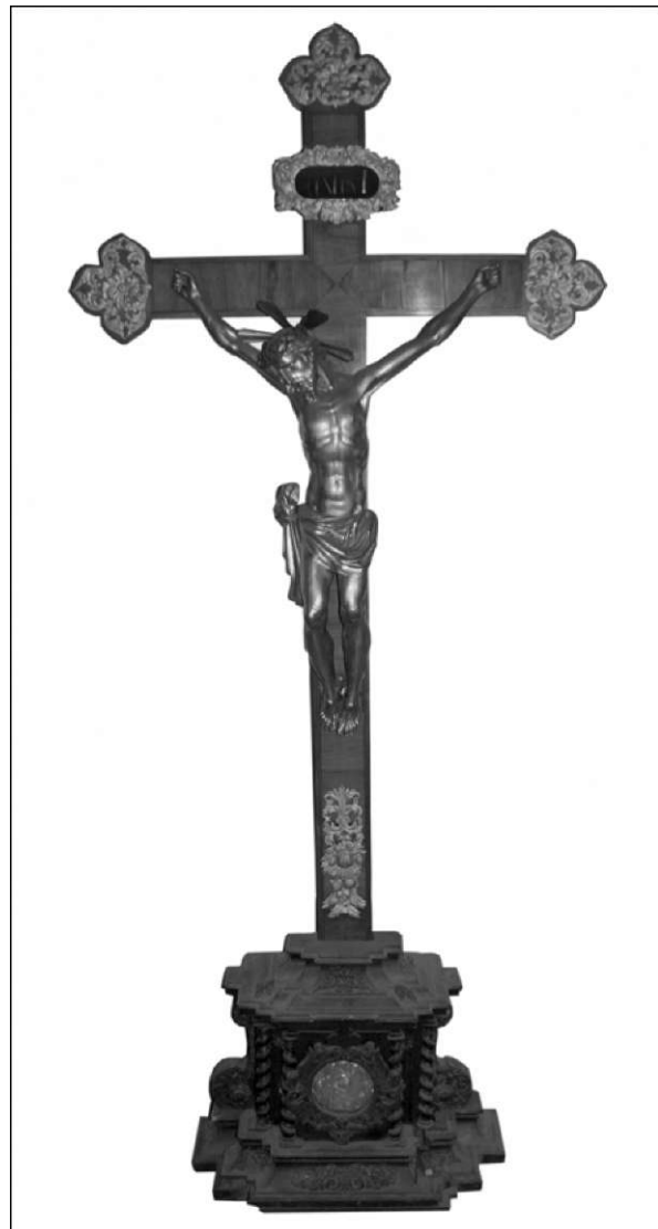
Križ t p/s podstavkom in aplikacijami i-y polnega 17. stoletja, Ljubljana, cerkev sv. Jakoba