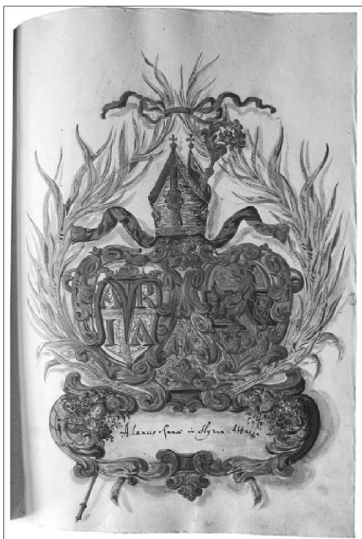
I-pisni list j-grbom jvinskeg opata-liana Malta (ARi, - IS 1073, II/52r)