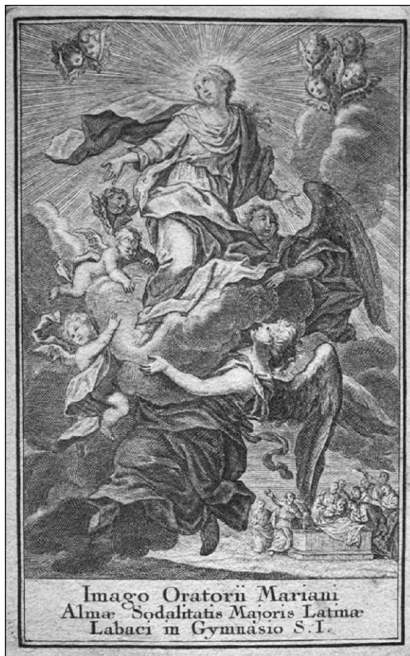
Marijino vnebovzetje, grafika veliko latinsko kongregacijo", ok. 1772 (SKLJ