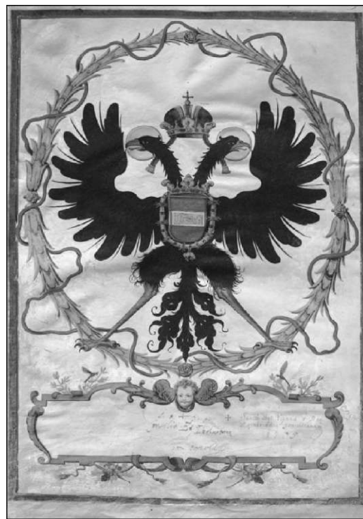
I pisni lisi z grbom cesarja Leopolda I, 1660 (ARS, - IS 1073,11/33)