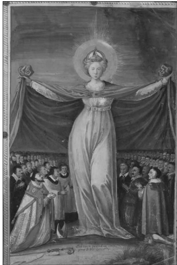
Marija Zavetnica s plaščem, Irontipic malrikitle konmmdje Marijinem vnebovzetja, o k. 1605 (AKt, - IS 1073,11/51r)