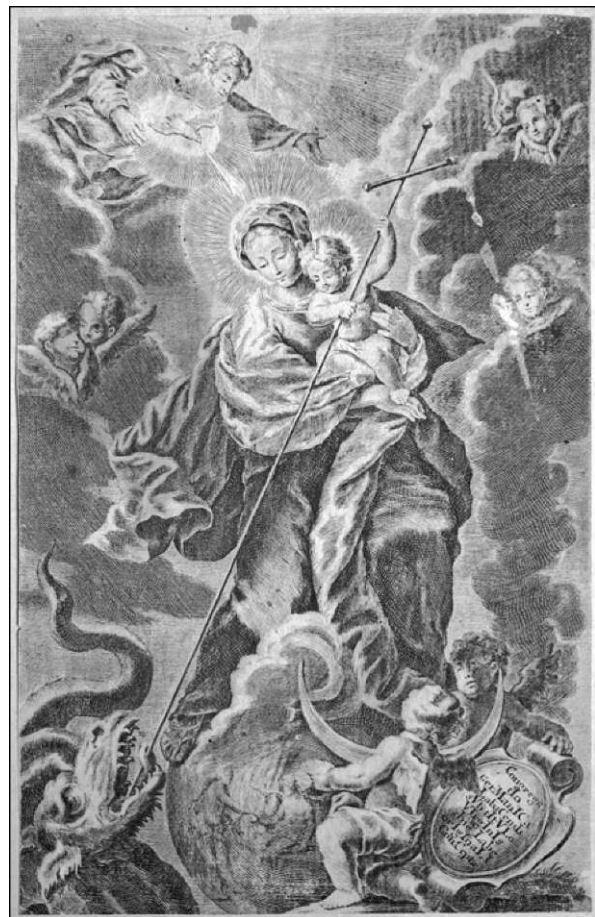
Marija Zmagovalka s prihorom »Izbrisan je dolg«, trafika Za kongregacijo Brezmadežnega spočetja, 1726 (SKL)

V teku 18. stoletja je kongregacija naročila več grafičnih podob, da jih je na titularni praznik delila med člane, isti motiv pa je uporabljala tudi za članska potrdila. Leta 1726 je dala v Augsburgu vrezati grafiko z motivom Marije Zmagovalke, ki je odtlej povsem prevladal. Gre za t. i. previdni tip upodobitve, saj je kot dejanski zmagovalec prikazan Jezušček, ki iz Marijinega naročja zabada križ v zmajevo žrelo. Prizor dopolnjujeta motiva učlovečenja (Bog Oče nad Marijo pošilja Svetega Duha) in izbrisanega dolga (puto briše z zemeljske oble podobo izvirnega greha). Zelo verjetno so isto kompozicijo poslej uporabljali tudi za kataloge umrlih članov, saj so dali leta 1727 za ta namen natisniti šest tisoč izvodov augsburških podob (za