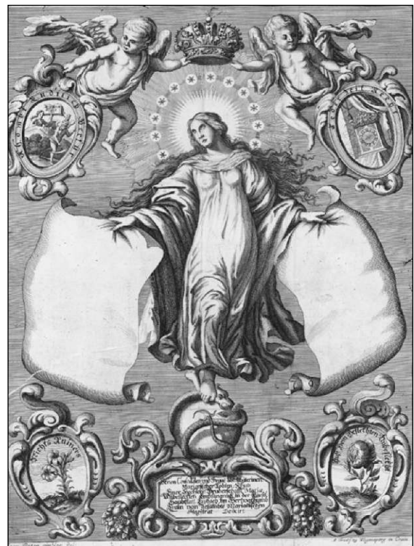
Johann Martin (vrezala delavnica Käsell): Brezmadežna, Janez Peter Gimbler (vrezal indrej Trost): Brezmadežna, 1670, Zagreb, Bibliotheca Metropolitana (T ZII, št. 66) 1679, Zagreb, Bibliotheca Metropolitana (T ZII, št. 65)