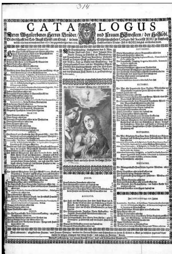
Seznam umrlih članov bratovščine Kristusovem smrtne boja s podobo duše v vicah, 1678, Zagreb, Bibliotheca Melropolitana ff 2 I, Št. 314

duše umrlih, nad njimi pa sta se dvigala lepa kipa Križanega in Žalostne Matere Božje. Ves aparat, za katerega so plačali več kot 70 £1, je poslikal večji čopič izkušenega umetnika, žal pa kroniški zapis ne sporoča njegovega imena. Častnim so osvetljevale številne laterne. 276 Nov katafalk so priskrbeli spet leta 1755. Na njegovem stopničastem podstavku je bila predstavljena očiščujoča ječa vic, ki so jo razsvetljevale številne luči, nad njo je bila mrtvaška žara z napisom Beati, cjiui in Domino moriunturl , na vrhu pa že star, zelo velik srebrn kip križanega Odrešenika, ob katerem sta stala Marija in Janez, izdelana iz lesa in posrebrena. 277