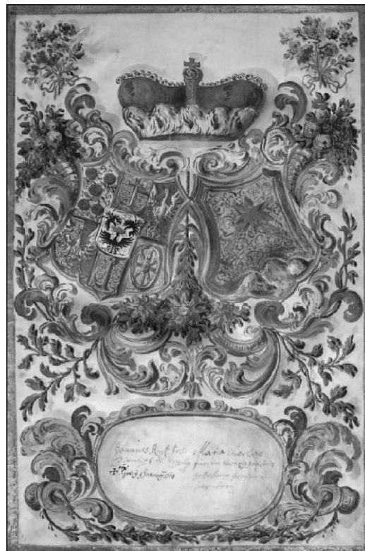
I pisni lisi z vrhom Janina Aniona Jozefa Byrnberzi (IRS, -IS /073,11/33)