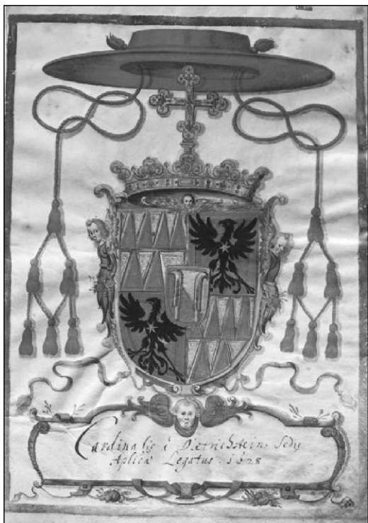
I- 'pisni lisi j (grbom Franca Serapha Dielrichsleina, 1628 (IRS, -iS 1073,11/33)