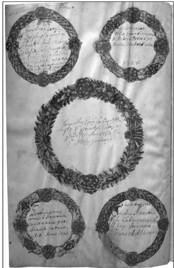
Folij-y. vpisom ljubljanskega škofa Feopolda Petačja in drugih uglednih članov f IRS,-iS 1073, III/51 r)

1639 lepo izdelan kip patrone Velike Matere, 38 1644 pa kelili s pateno v vrednosti 60 fl. 39 Med darili so bile v letu 1646 omenjene podobe precejšnje vrednosti, med nakupi pa polsvileni zastori za prevleko oratorija. 40 Okras za svečanosti je kongregacija še pomnožila leta 1648, 41 zato letopisec upravičeno poroča o sijajni opravi, s katero je naslednje leto praznovala titularni praznik Marije vnebovzete. 42 Za številne teatralne inscenacije, »aparate« in podobno provizorično okrasje je potrebovala kipe in slike z motivi, nanašajočimi se na konkretne praznike; ko je leta 1654 za voditelja dobila stiškega opata, ji je ta poklonil sto srebrnih goldinarjev za nakup takšnih podob. 43 Sto goldinarjev je prejela tudi leta 1673 iz volila baronice Barbare Ivacija-