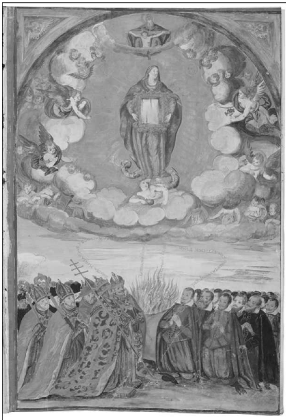
Brezmadežna s člani bratovščine, fivntispicmatrikide kongregacije Brezna dednegaspočetja Č 1R5, ti 1073, II/52r)

Kongregacija Vnebovzete se je številčno hitro povečevala, zato so jo leta 1624 razdelili na dva dela. 113 Nova veja, z imenom Brezmadežnega spočetja, je združevala moške različnih stanov, vpisovali