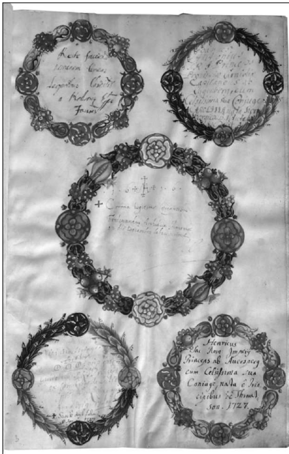
Folij z vpisom nadvojvoda Ferdinanda in drugih uglednih članov