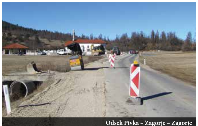
Odsek Pivka - Zagorje - Zagorje