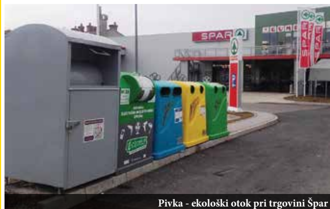
Pivka - ekološki otok pri trgovini Špar

V tipske zbiralnike lahko oddate naslednjo odpadno električno in elektronsko opremo.