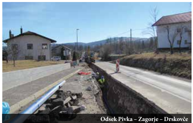
Odsek Pivka - Zagorje - Drskovče