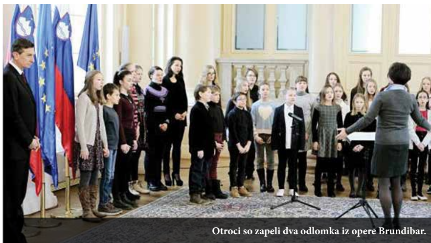
Otroci so zapeli dva odlomka iz opere Brundibar.

Ob mednarodnem dnevu spomina na žrtve holokavsta (27. januarja) je predsednik Republike Slovenije Borut Pahor v Predsedniški palači sprejel predstavnike Judovskega kulturnega centra Ljubljana, Judovske skupnosti v Sloveniji, predstavnike slovenske delegacije pri Mednarodni zvezi za spomin na holokavst (IHRA), predstavnike Koordinacije taboriščnih odborov pri Zvezi združenj borcev za vrednote NOB Slovenije in taboriščnice, ki so preživele nemška koncentracijska taborišča. Na dogodku so bili tudi producenti opere Brundibar v Sloveniji: Glasbena matica Ljubljana, Akademija za glasbo v Ljubljani, Cankarjev dom in Slovensko komorno glasbeno gledališče.