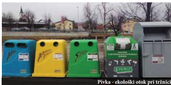
Pivka - ekološki otok pri tržnici