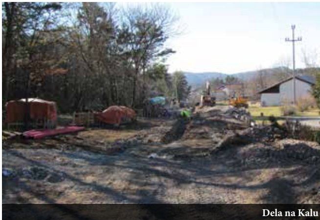
Dela na Kalu

Gradbena dela na cevovodih potekajo tudi na območju naselja Kal . Tu so trenutno tri gradbišča. Eno poteka po javni poti mimo objektov s hišno številko Kal 16b. Na tem delu potekajo izkopi, polaganje cevi in tudi že zasipi. Drugo gradbišče je na poljski poti od Kala proti hlevom. Tu se dela že zaključujejo, izvajalci opravljajo dela na urejanju poljske poti in humuziranju brežin. Tretje gradbišče pa je na odseku od hlevov proti državni cesti za Neverke. Na tem delu je izvedeno čiščenje terena ter izkopi.