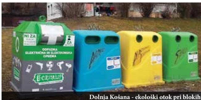
Dolnja Košana - ekološki otok pri blokkih