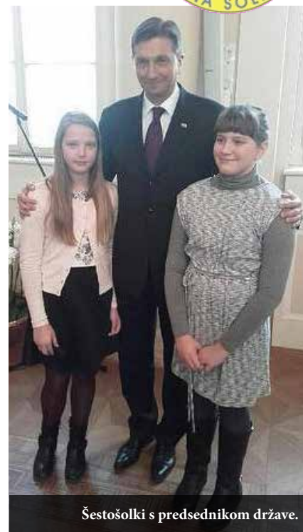
Šestošolki s predsednikom države.