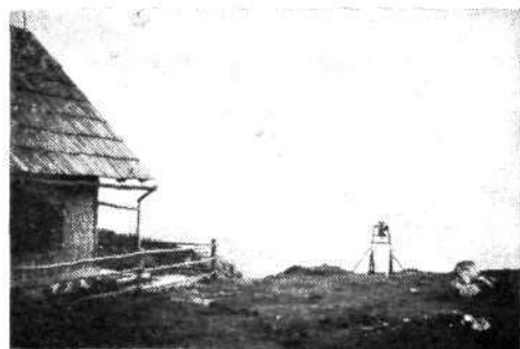
Pri Krekovi koči na Ratitovcu leta 1939