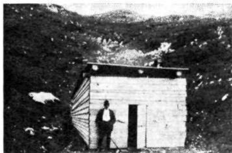
Začetek gradnje: zasilna baraka v globeli pod stavbiščem junija 1923