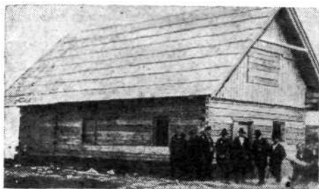
Krekova koča spomladi 1924

V letih prve svetovne vojne — tj. od 1915 do 1918 — kot je bilo že poudarjeno, o društveni dejavnosti ni več govora. Kruta vojna vihra je svet takó silno razburkala, da vse — kar je prej stálo na nogah — je bilo v tem času postavljeno na glávo.