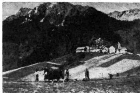
Na Prtovču leta 1934