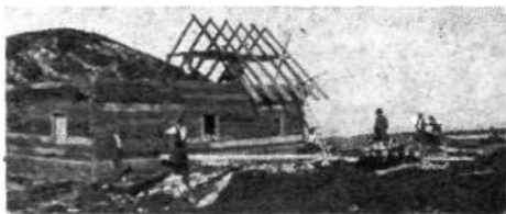
Pri gradnji koče septembra 1923