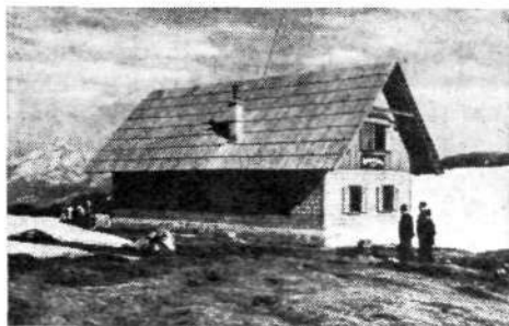
Spomladi 1925