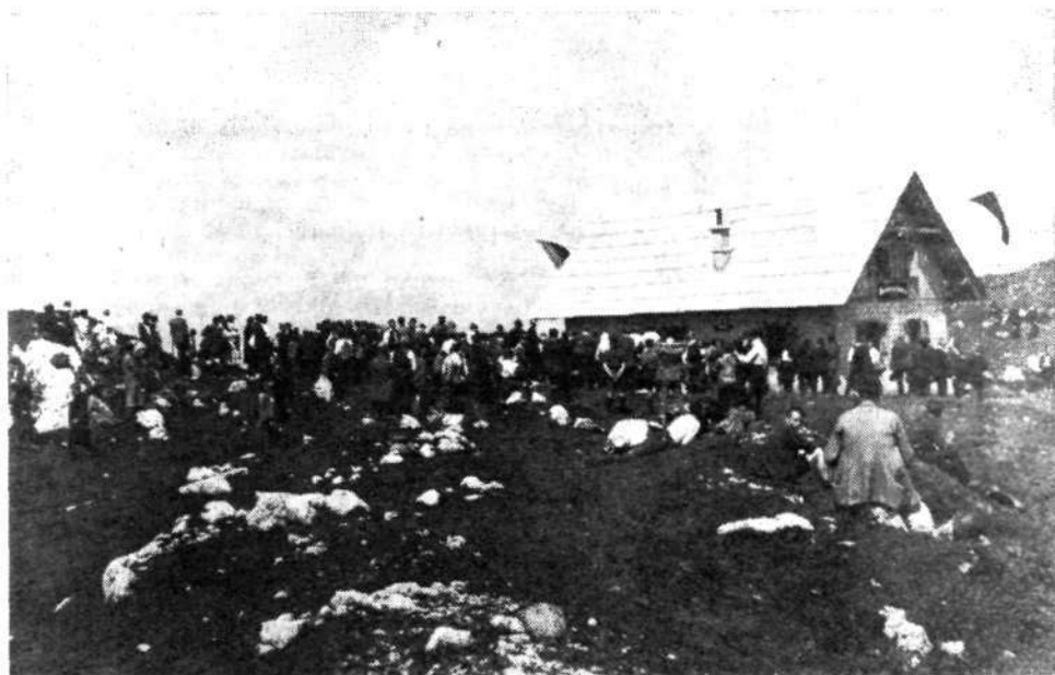
Ob otvoritvi Krekove koče na Ratitovcu 9. avgusta 1925

Pravi narodni praznik je postala otvoritev te koče. Kakor na božjo pot so romali planinci iz vseh krajev Slovenije skupaj s kmetskimi fanti in brhkimi dekleti Selške doline na planoto, kjer stoji