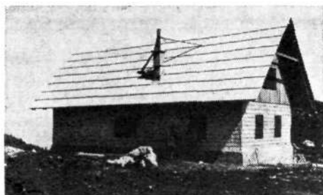
Jeseni 1924