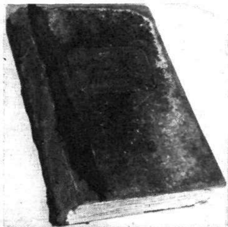
Vpisna knjiga od otvoritve 1925 do 1940

za zgraditev t. i. »Rupnikove linije« (tudi na Ratitovcu), o čemer sem marsikakšno »zanimivost ujel« prav v koči, ko sem dvakrat imel v gosteh najvišje generalštabne oficirje bivše jugoslovanske vojske. Moje zle slutnje je slednjič podkrepil še dopis GO SPD Ljubljana, št. 1024/40-T, z dne 8. aprila 1940 z obvestilom, »da se vedno bolj bližamo dnevu, ko bomo morali izročiti kočjo vojaški upravi«. In res: 1. maja 1940 smo iz kočje že morali spraviti vse premičnine julija pa sem »vpisno knjigo« zaključil z naslednjo pripombo: »V letu Gospodovem 1940 je prenehalo utripati gospodarско srce Krekove kočje v znamenju predpriprav na nejasno bodočnost.«