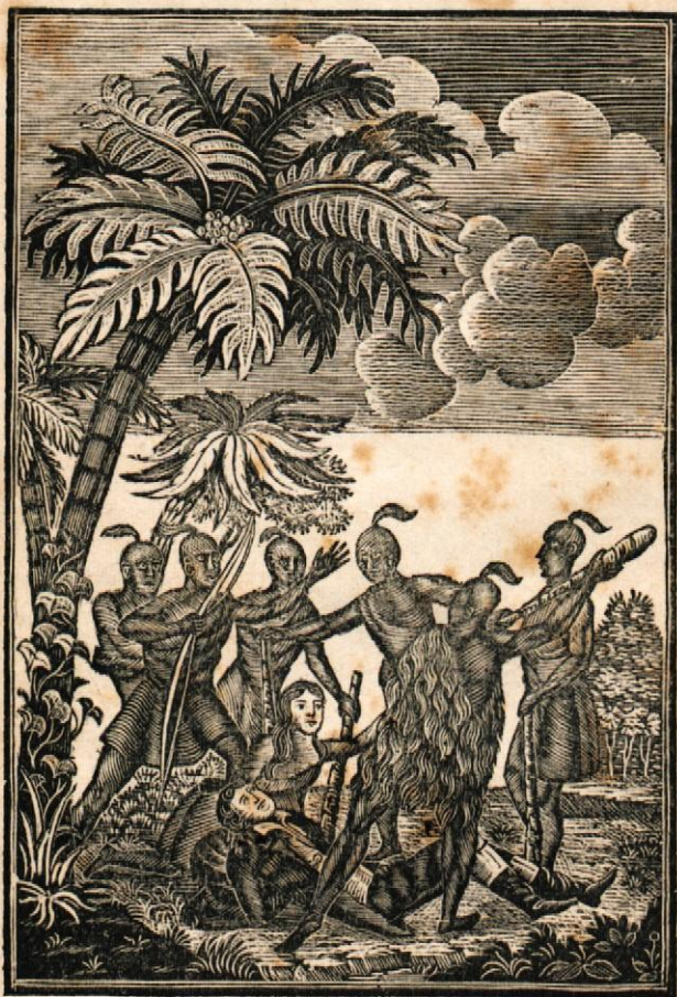
Pokahonta ohráni kapitana Janesa Šmita per shivljenji. (Glej stran 8.)