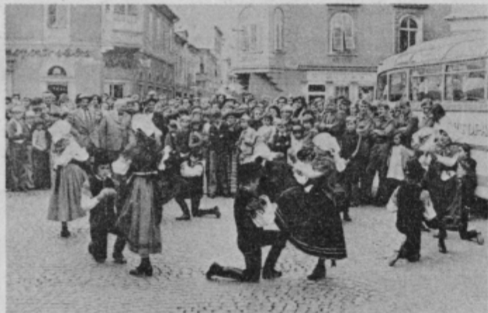
Občani Ptujja in folklorna skupina iz Markovec so dragim gostom pripravili na Trgu MDB prisrčen sprejem

V tem kratkem času je bilo težko izpovedati vso širino ljubezni, dobrote, ki jo slovenski brat čuti do srbskega brata. Kljub desetletjem, ki so pretekla od tistega dne, ko je zavojevalec pričel uresničevati svoj načrt „zbrisanja Slovenije z zemeljske površine“, načrt krutege izseljevanja od domačega ognjišča, je nezbrisljiv spomin na vso dobroto, ki so je bili deležni Slovenci ob svojem „preseljevanju“ v Srbijo. Čeprav daleč od doma je našel prijatelja, ki mu je v tistih viharnih dneh nudil drugi dom, nudil zavetje in oporo v njegovem nadaljnjem boju proti sovražniku.