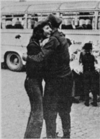
Prisrčen pozdrav in bratski objem

Ko smo se v torek 8. junija poslovili od dragih gostov, se je marsikomu orosilo oko; znova sta se prijatelja: azšla toda prežeta z globoko in jejo, zavestjo in prepričanostjo, da se znova srečata in še trdneje skleneta to vez prijateljstva, bratstva in enotnosti ter solidarnosti, ki daje moč boju naše socialistične družbene skupnosti proti slehernemu negatorju naših revolucionarnih prodobitev in samoupravnemu razvoju. MG