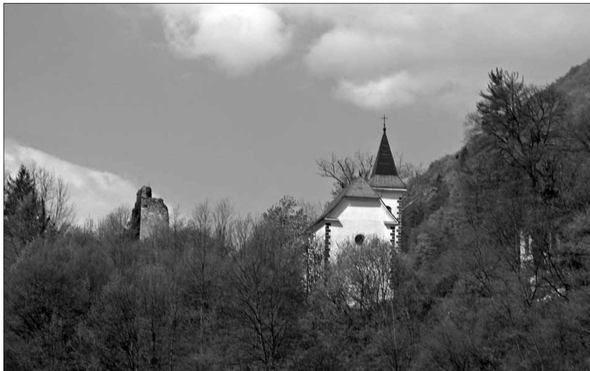
Danes obnovljena Marijina grajska kapela na Mediji je preživela partizansko miniranje gradu jeseni 1944 (foto: B. Golec, april 2008).

razlog, da so otroke Jerneja Valvasorja krščevali na domačem medijskem gradu, od leta 1637 v novo-zgrajeni prostorni kapeli ob grajskem kompleksu. 83