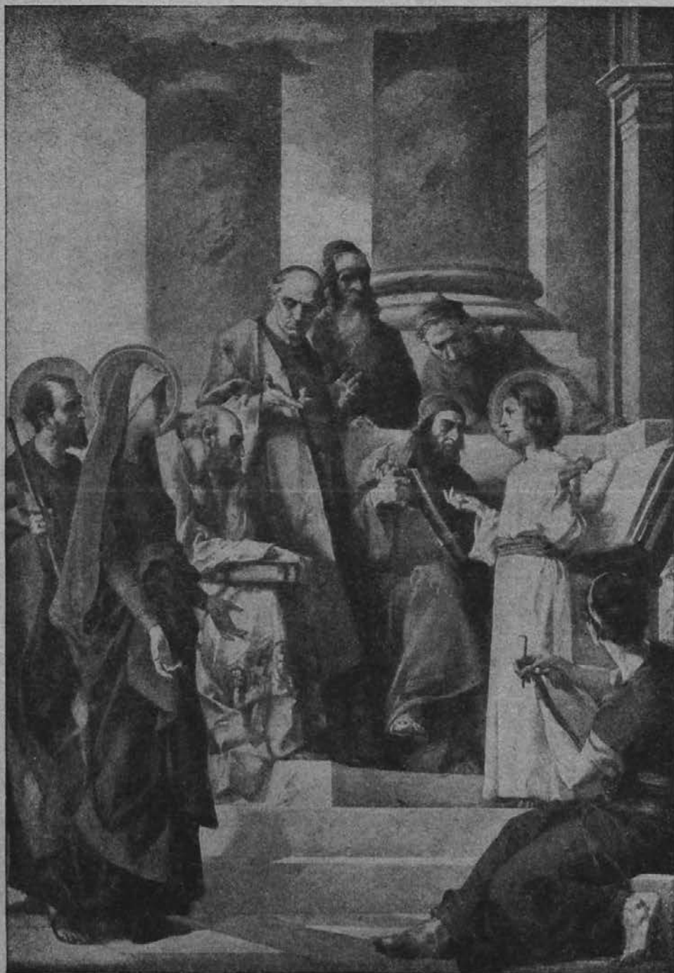
Dvanajstletni Jezus v tempeljih