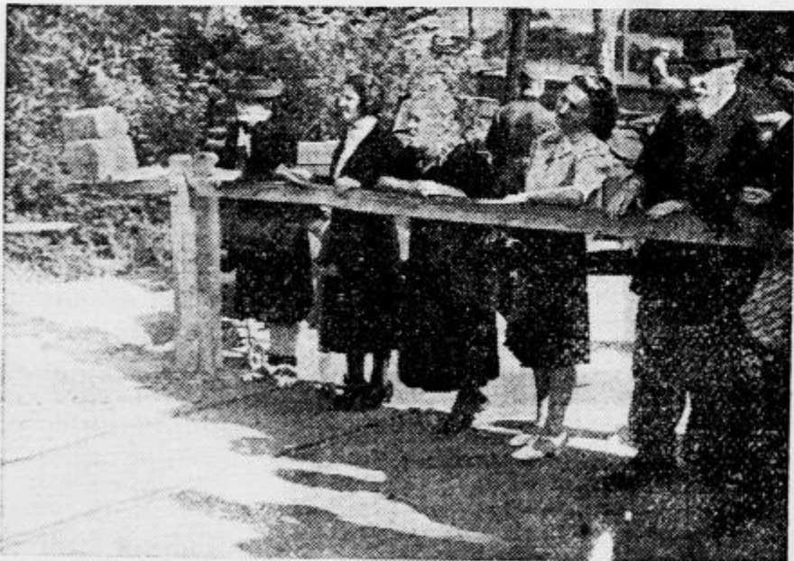
stojte Francozi na demarkacijski črti med nezasedeno in zasedeno Francijo v Bellegardu