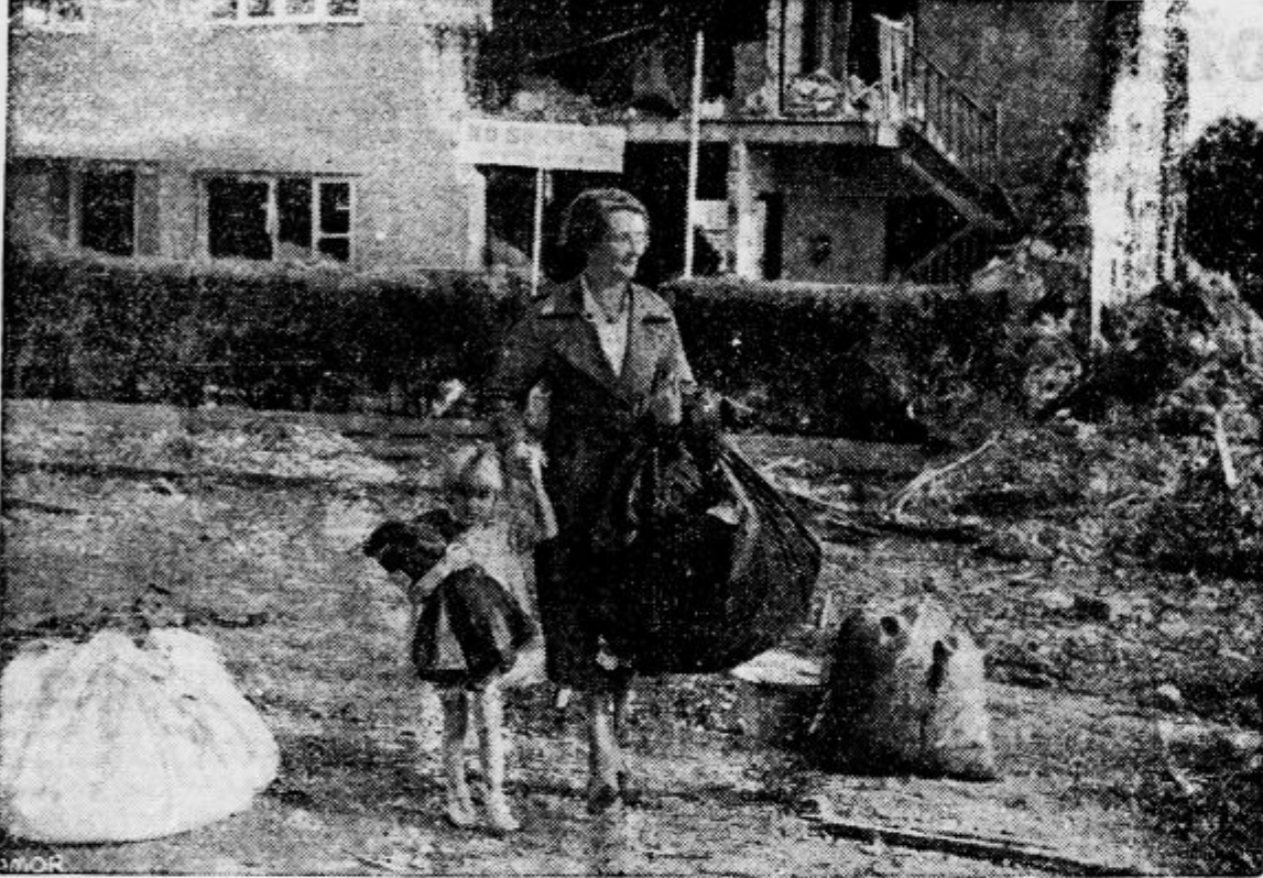
zapušča stanovanje, katerega je porušila nemška bomba