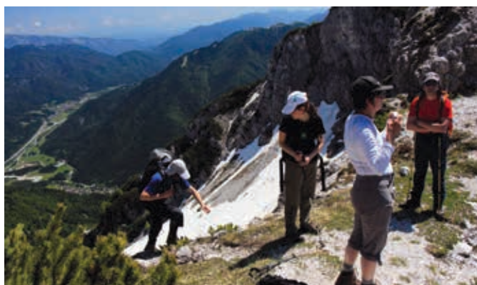
Na grebenu med Strehico in vrhom, levo spodaj Žabnice v Kanalski dolini

Prvo junijsko soboto in tik pred nastopom letošnjega prvega vročinskega vala smo trzinski planinci odšli k sosedom na spogledovanje z zimo, vendarle pa še »v domačo gorsko skupino« Zahodnih Julijskih Alp, kjer najdemo prvovrstni razglednik – Poldašnjo špico. Vrh je znanilec poldneva za bližnjo vasico Naborjet v Kanalski dolini, povedano drugače – opoldne je za vaščane sonce točno nad tem vrhom (od tod tudi naše Martuljške in Rateške Ponce oziroma gore poldnice).