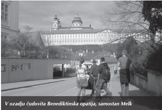
V ozadju čudovita Benediktinska opatija, samostan Melk

z vlakom proti Dunaju, kamor smo prispeli v petek, malo pred 10. uro. Po hitri namestitvi v hostlu Pension Vienna Happymit smo takoj vzeli pot pod noge in se odpravili z vlakom v nekaj ur oddaljeni Melk, natančno v mogočno benediktinsko opatijo, samostan, ki kraljuje na skalnatem pobočju nad Donavo. Začetki samostana segajo v 11. stol., današnja podoba pa je pridobil v 18. stol. Samostan Melk slovi kot najpomembnejša stvaritev avstrijske baročne umetnosti. Tam smo obiskali tudi mogočno cerkev, ki prekipeva v sijajnem baroku: stropne freske, štukature, pozlačeni oltarji, mogočni barvni marmorni stebri, prižnica in orgle, vse to se zliva v eno samo simfonijo vrhunske umetnosti.