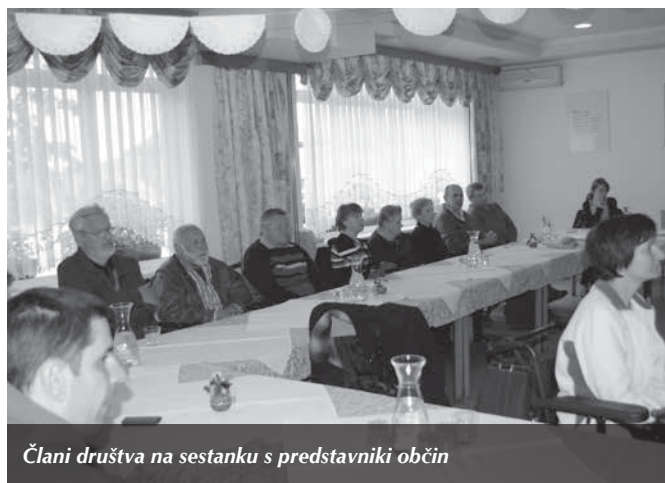
Člani društva na sestanku s predstavniki občin

Društvo paraplegikov ljubljanske pokrajine je 13. maja v prostorih gostišča Soklič v Zalogu pri Krtini pripravilo delovni sestanek članov društva s predstavniki občinskih institucij, predstavnic ZZS in predstavniki Zveze paraplegikov Slovenije. Delovnega srečanja so se udeležili člani, ki živijo v občinah Domžale, Trzin, Mengeš, Lukovica, Moravče in Dol pri Ljubljani. Z omenjenimi predstavniki so razpravljali o različnih težavah, s katerimi se vsakodnevno srečujejo.