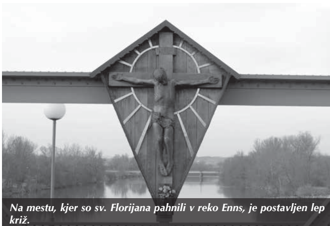
Na mestu, kjer so sv. Florijana pahnil v reko Enns, je postavljen lep križ.

Sam most, s katerega je sv. Florijana v reko porinil nek mladenič, smo iskali peš kar dobri 2 uri – na koncu je bil naš trud vendarle poplačan. Pred mostom smo videli kamnit kip, ki prikazuje zvezanega Florijana, preden so ga pahnil v reko, v skalo pa je vklesan datum – 4. maj 304. Na mostu, pod katerim teče reka Enns, je postavljen lep križ – tam smo pomolili, se priporočili sv. Florijanu, naredili skupinsko fotografijo in se po sončnem zahodu odpravili na vlak.