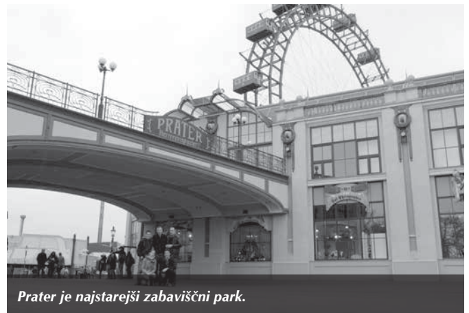
Prater je najstarejši zabaviščni park.

V nedeljo smo imeli pred vrnitvijo v Ljubljano še nekaj časa. Po jutranji sv. maši in okusnem zajtrku smo si šli ogledat Prater, najstarejši zabaviščni park. Področje Pratra je odprto za javnost od leta 1766 in je bilo prvotno namenjeno oddihu, zato so se tam najprej pojavile taverne, kavarne, manjši klasični vrtljaki, kegljišča in gugalnice. Leta 1895 so zgradili veliko kolo (Riesenrad),