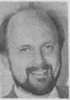
Zmago JELINČIČ, roj. 7. 1. 1948, farmacevt, Ljubljana, Ul. 7. korpusa 74