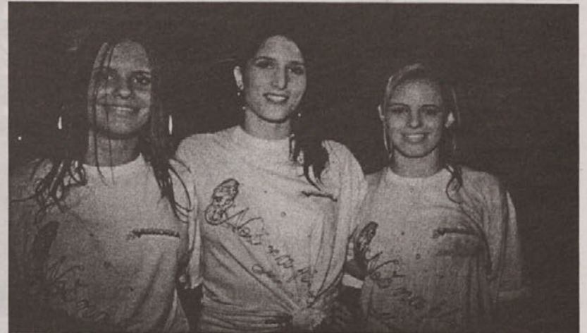
Tri najlepše stuširane v televizijski oddaji TV Primorka, Noč na plaži, ki se je zgodila na plaži v Simonovem zalivu.