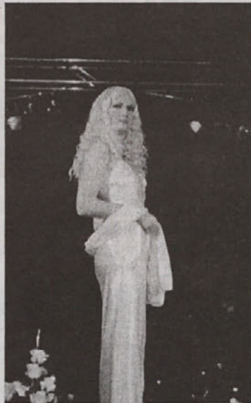
Na zelo glamurnem piranskem izboru slovenske predstavnice za lepotno tekmovanje Miss Italia nel mondo smo imeli Izolani tudi svoje adute.