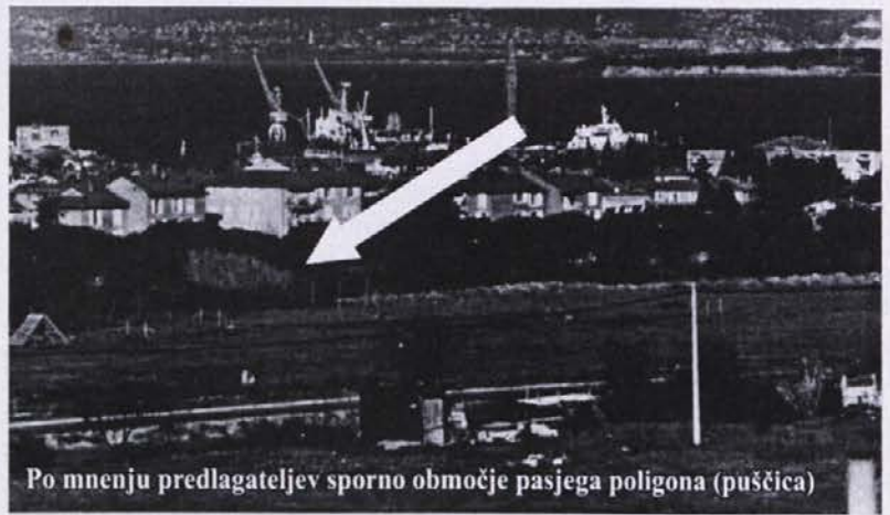
Po mnenju predlagateljev sporno območje pasjega poligona (puščica)

Priloga: - seznam in podpisi volivcev in volivk, ki podpirajo pobudo, (3.odst. 13. člena zakona o referendumu in ljudski iniciativi Ur.l.RS 15/94)