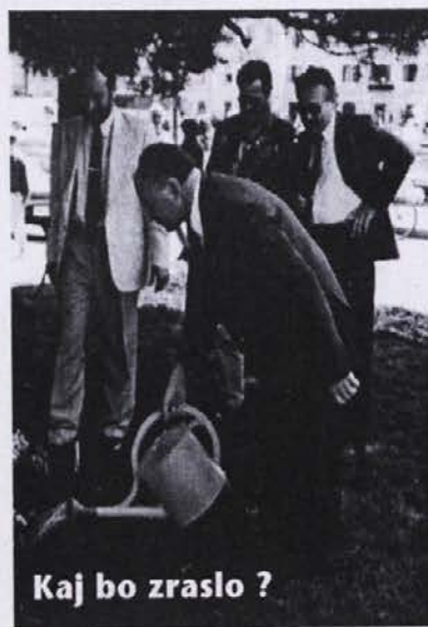
Kaj bo zraslo?

V združenju si že na začetku leta porazdelimo aktivnosti in naloge. Letos smo začeli s ponatisom starega kataloga oziroma prospekta mesta Izole, ki smo ga ponatisnili v 13.000 izvodih. Polega tega je v pripravi popolnoma nov prospekt, ki bo izšel v kratkem. V načrtu pa imamo še plakat Izole, načrt mesta, vodnik po mestu - brošura, poslovna mapa in cenik hotelskih storitev, zasebnih sob, apartmajev, kampingov...in sploh vseh zadev, ki se v Izoli ponujajo na področju turizma. Imamo tudi predvideno izboljšavo infrastrukture v mestu, predvsem usmerjevalne signalizacije, npr. sprehajalnih poti in podobno.