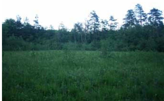
Pozno pomladni prizor barja pri Trzinu, ki se je dolgo skrivalo očem botanikov.