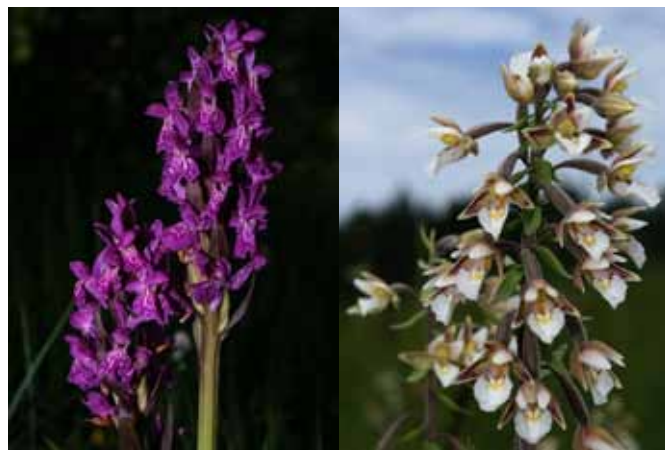
Majska prstasta kukavica in navadna močvirnica sodita med najlepše orhideje v Sloveniji

Loeselova grezovka je samo ena izmed nekaj več kot osemdesetih vrst orhidej, ki v Sloveniji uspevajo v naravi. Skoraj vse so zakonsko zavarovane, saj je večina redkih ali ogroženih, zlasti tiste, ki so vezane na barja in mokrotne travnike. Od takšnih bomo v barjih pri Trzinu zagotovo našli majsko ( Dactylorhiza majalis ) in mesnordečo prstasto kukavico ( Dactylorhiza incarnata ) ter navadno močvirnico ( Epipactis palustris ).