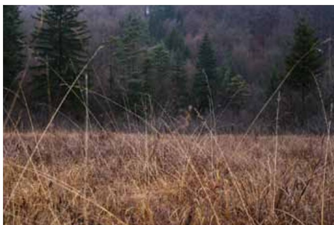
Najlepše ohranjeno barje pri Trzinu v pozni jeseni, rastišče mnogih redkih in ogroženih rastlin

Pri prehodnih barjih , kamor spadajo tudi nekatera v občini Trzin, se v celoti ali delno mešata mineralno revna padavinska voda in mineralno bogatejša podtalnica ali površinska voda. V Sloveniji se večinoma pojavljajo kot obrobne površine nekaterih visokih barj, nekaj manjših koščkov pa najdemo še v širši okolici Ljubljane.