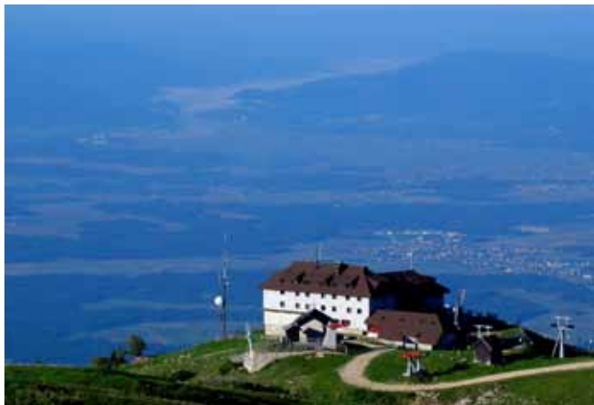
Septembrski razgled s Krvavca