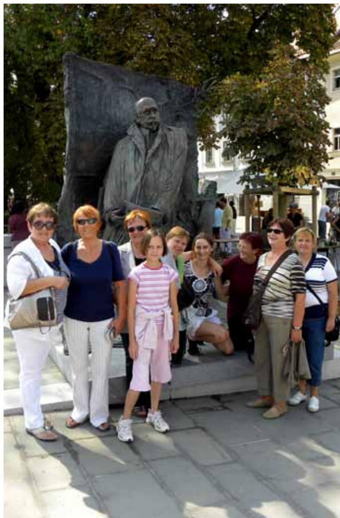
Pred spomenikom Hribarja na obrežju Ljubljanice

Eden od štirih dogodkov v Hribarjevem letu v Trzinu je bil tudi organiziran ogled Hribarjeve Ljubljane.