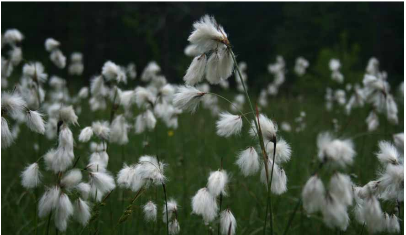
Zaradi izginjanja barij so takšni atraktivno lepi prizori vedno bolj redki. Na sliki ozkolistni munec.

To so samo nekatere posebne in ogrožene vrste rastlin, ki so zaradi zanje ugodnih ekoloških pogojev našle rastišče v okolici. Celotna dolina Motnice je botanična dragocenost izjemnega državnega pomena, zlasti zaradi lepo ohranjenih barjanskih površin, o katerih lahko denimo sosednja Koroška na Avstrijskem samo hrepeni. Tukajšnja populacija evropsko ogrožene orhideje Loeselijeve grezovke je gotovo eno najpomembnejših v tem delu Evrope. Na Hrvaškem in v Bosni je nimajo, v Italiji je znanih nekaj maloštevilčnih populacij, v Avstriji prav tako, na Madžarskem je skoraj izumrla. To je razlog za velika prizadevanja večine evropskih držav, da skozi razne ohranitvene projekte ohranijo to drobno barjansko rožico. Če bomo znali v gozd stopiti s spoštovanjem in zavestjo, da je to življenjski prostor številnih živalskih in rastlinskih vrst, in vedeli načrtovati infrastrukturno in gozdno-gospodarsko prihodnost v sožitju z naravno biodiverzitetjo, bomo brez dvoma uspeli. Prihodnji rodovi nam bodo hvaležni za to nesebičnost.