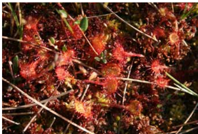
Okroglostna rosika s svojimi žlezami lovi mušice, komarje in druge žuželke.

Če veljajo orhideje za najbolj eksotične barjanske rastline v Sloveniji, pa so rosike gotovo najbolj vznemirljive, nenavadne in drugačne, saj so namesto fotosinteze brez slabe vesti raje izbrale lovljenje raznih insektov, ki se prilepijo na njihove lepljive žleze, ki nato iz njih izsesajo hranilne snovi. Okroglostna rosika ( Drosera rotundifolia ) je značilnejša za mineralno revnejša barja, zato jo bomo le stežka spregledali na visokih barjih Pohorja ali Pokljuke, pojavlja pa se tudi v prehodnih in nizkih barjih v nižini. Kljub temu velja v Sloveniji za ogroženo vrsto, zato sta dve nahajališči pri Trzinu vredni velike naravovarstvene pozornosti. V neposredni bližini Trzina, le nekaj deset metrov od najbližjih hiš, uspeva še ena izmed treh pri nas rastočih rosik, to je srednja