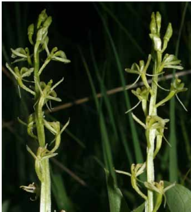
Loeselova grezovka – ena najredkejših rastlin v Sloveniji in Evropi

Odkrita je bila šele v začetku 20. stoletja, ko jo je v majhnem barju pod Rožnikom našel A. Paulin, a je zaradi ekoloških sprememb rastišča v nekaj desetletjih tam žal izumrla in veljala za takšno do leta 1970, ko je bila najdena blizu Hotederšice pri Logatcu. Zahvaljujoč sistematičnemu iskanju populacij grezovke, je danes širom Slovenije znanih nekaj več nahajališč, kar je izjemno dragoceno, saj so slovenske populacije najjužnejše v svojem celotnem arealu.