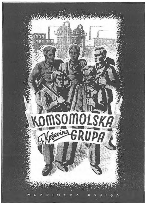
Propagandna knjižica Komsomolska grupa (Mladinska knjiga, Ljubljana 1948)

Mladino so že zgodaj pritegnili k republiškim zveznim delovnim akcijam; največje in najzahtevnejše so bile v Bosni, kjer so gradili železniške proge. Tudi več tisoč nemških vojnih ujetnikov in političnih zapornikov je v tem času obnavljalo prometnice, gradilo industrijske objekte, delalo v rudnikih in gozdovih.