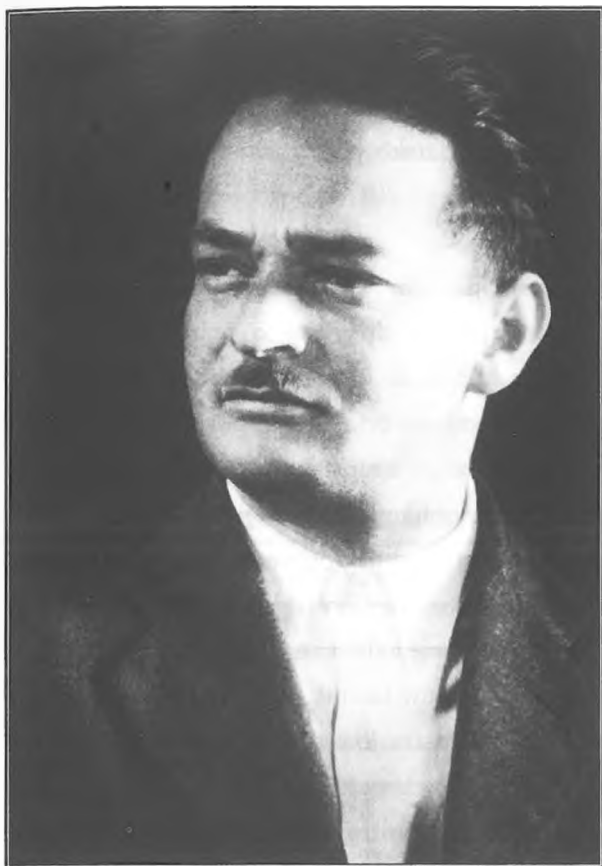
Boris Kidrič (1912–1953) je leta 1945 postal predsednik slovenske vlade, 1946 pa minister za industrijo vlade FLRJ. Bil je eden od tvorcev planskega gospodarstva, ki so ga zasnovali po sovjetskem vzoru.