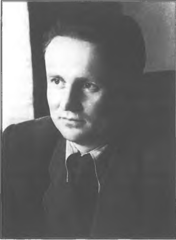
Boris Kraigher (1914–1967) je bil od 1953 do 1962 predsednik slovenske vlade, nato pa podpredsednik zvezne vlade, kjer je vodil odbor za pripravo gospodarske reforme.

Konec leta 1964 so spremenili sistem dohodka, marca naslednjega leta pa zamrznili cene izdelkom in pridelkom. Ta dva ukrepa sta bila uvod v gospodarsko reformo. Njeni cilji in načela so bili predstavljeni julija 1965. Boris Kraigher, njen idejni tvorec, jih je predstavil takole: