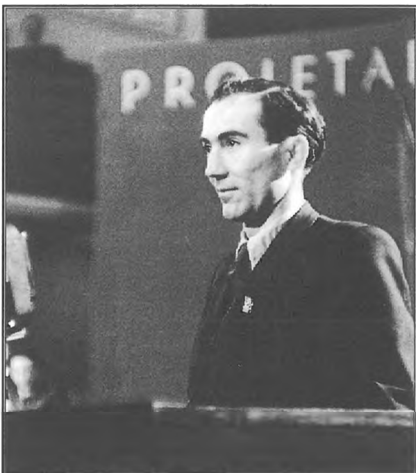
Stane Kavčič (1919–1987) je bil od 1967 do 1972 predsednik slovenske vlade. Prizadeval si je, da bi republika Slovenija lahko sama odločilno vplivala na svoje gospodarstvo.

Konec 60. let se je začela rahljati povezanost slovenskega gospodarstva z jugoslovanskim. S srednjeročnim gospodarskim planom za obdobje 1966–1970 je slovenska vlada napovedala, da hoče imeti večjo vlogo pri oblikovanju gospodarskega sistema. Po sprejetju ustave in zakona o združenem delu je naša republika še okrepila prizadevanja, da bi republiški organi postali glavni in odločilni dejavnik na gospodarskem področju.