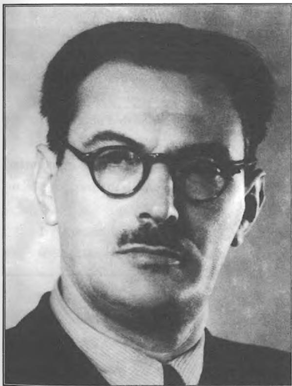
Franc Leskošek (1897–1983) je bil od 1945 do 1948 minister za industrijo v slovenski vladi, pozneje pa minister za težko industrijo v vladi FLRJ. Spodbujal je povojno industrializacijo in skrbel zlasti za gradnjo težke industrije v Sloveniji (Litostroj, Metalna).

Proizvajalec in kraj proizvodnje sta bila v planu določena le izjemoma, kajti to je bilo prepuščeno generalnemu (glavnemu) planu industrializacije in republiškim načrtom. Generalni plan industrializacije