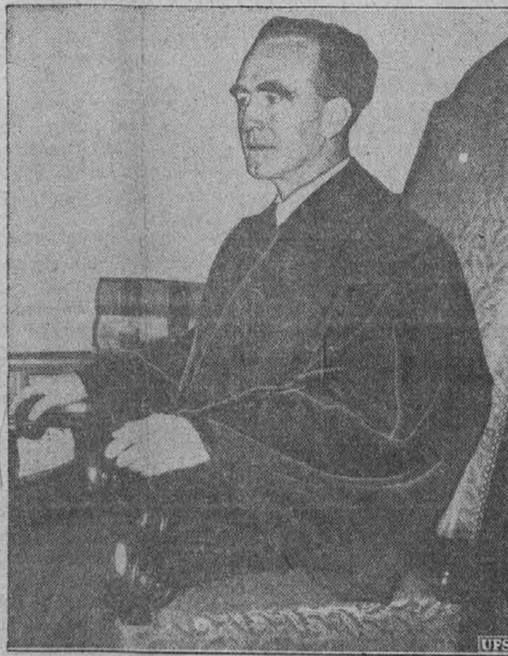
Na sliki je Frank Murphy, bivši tajnik justičnega departamenta, katerega je predsednik Roosevelt imenoval za člana vrhovnega sodišča Zedinjenih držav.