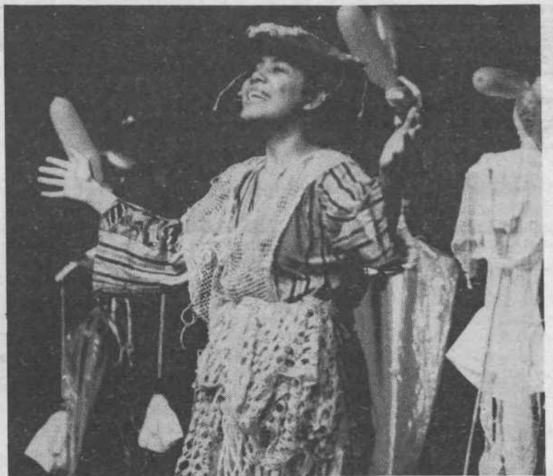
Na sliki: Gledališče tretjega sveta.