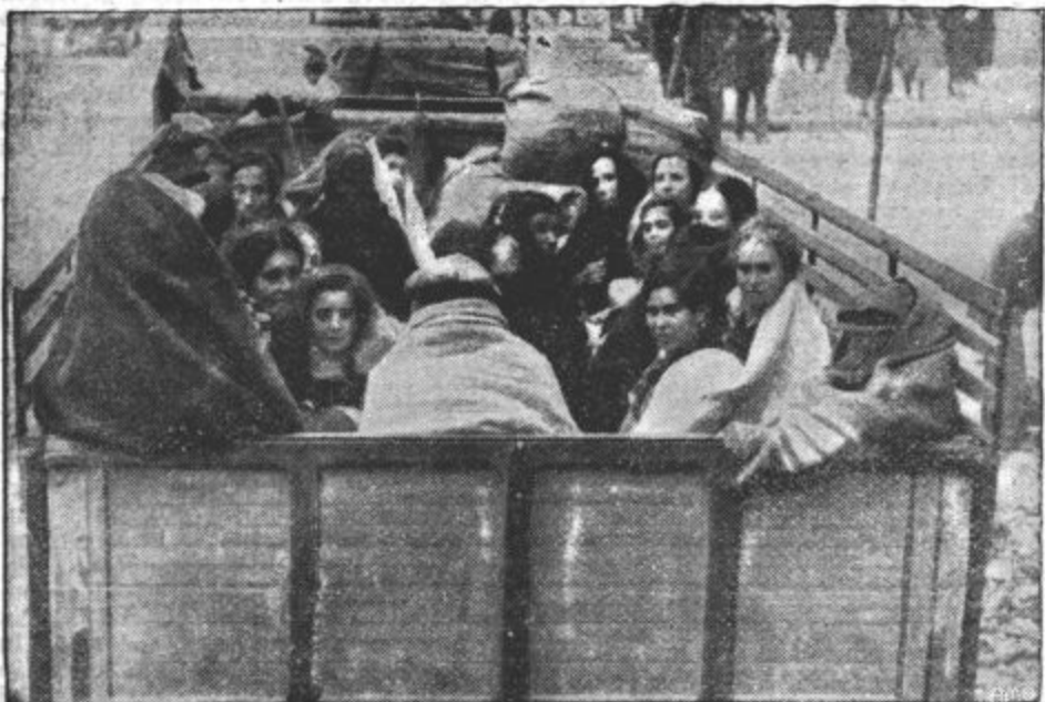
MADRID IZPRAZNUJEJO. Zaradi neprestanih bombnih napadov na Madrid je začela španska vlada izpraznjevati prestolnico. Ženske in otroke odvažajo s tovornimi avtomobili v zaledje.