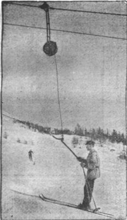
NOVOST ZA SMUČARJE. V St. Moritzu v Švici so smučarjem na razpolago vsakovrstni pripomočki, med drugimi tudi žica, ki jim pomaga na strma pobočja planin.