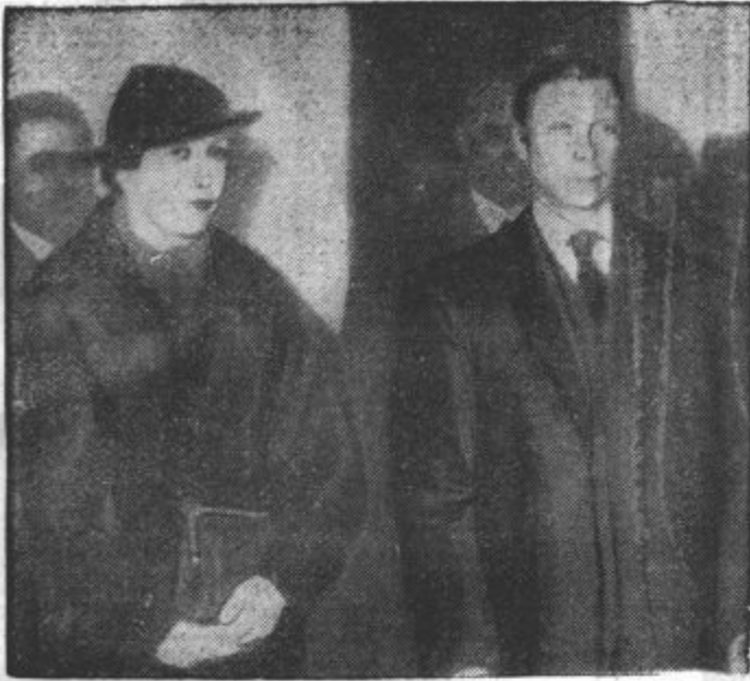
Te dni se je pripeljala v Enzesfeld k svojemu bratu, bivšemu angleškemu kralju Edvardu VIII. v obisk njegova edina sestra, princesa Mary. Vojvoda se je dal z njo fotografirati v čakalnici na dunajskem kolodvoru.