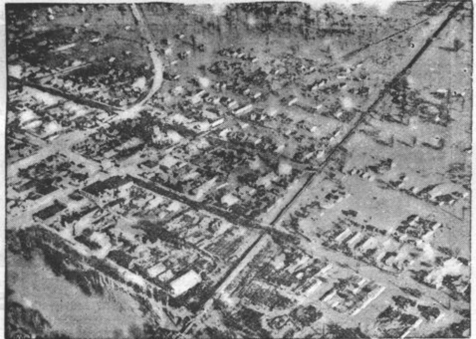
POPLAVE BREZ KONCA NE KRAJA. Poplar Bluff, katerega so pokrile vode iz reke Black, pritoka Missisipija.