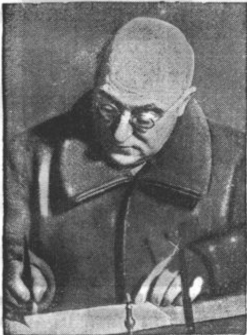
BRANILEC MADRIDA, general Miaja pri delu.