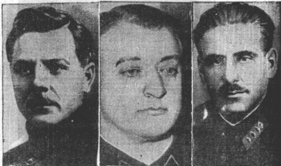
TRIJERDEČI MARŠALI. Vorosilov, Tuchačevski in Blücher, na katere se naslanja Stalinov režim.