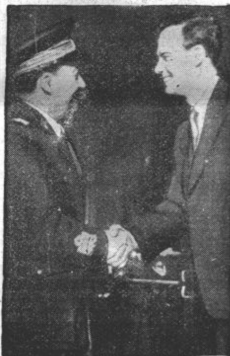
Zmagovalec Atlantika, polkovnik Lindbergh je med svojim neprosto voljnim bivanjem v Rimu obiskal tudi maršala Balba.