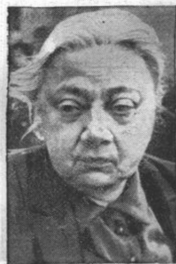
NISO JE ARETIRALI V zvezi z zadnjimi dogodki v Moskvi so se razširile vesti, da je aretirana tudi Leninova vdova, gospa Krupskaja. Uradna vest iz Moskve pravi, da se to ni zgodilo.