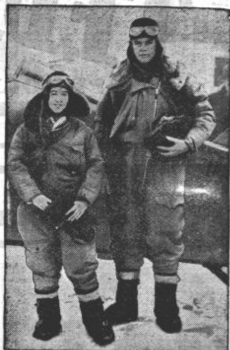
ZMAGOVALEC OCEANA, LETALEC CHARLES LINDBERGH IN NJEGOVA ŽENA. Lindbergh se je te dni izgubil na poletu čez Alpe ter je moral pristati v Pisi. Od tam je šel naprej v Rim, v Rimu pa je najel novo letalo, ki ga je neslo dalje v Kairo.