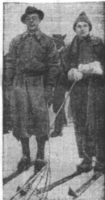
MEDENI TEDNI NA SMUČEH. Holandska prestolonaslednica princesa Julijana s svojim soprogom v Krynici na Poljskem.