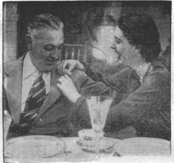
LOČITEV NAJLEPŠEGA MOŠKEGA. Iz Amerike poročajo, da se bosta po komaj tri mesece trajajoči zakonski skupnosti ločila John Barrymore, ki slovi širom Amerike zaradi svoje vnanje prikupnosti, in njegova žena Elaine Barrie.