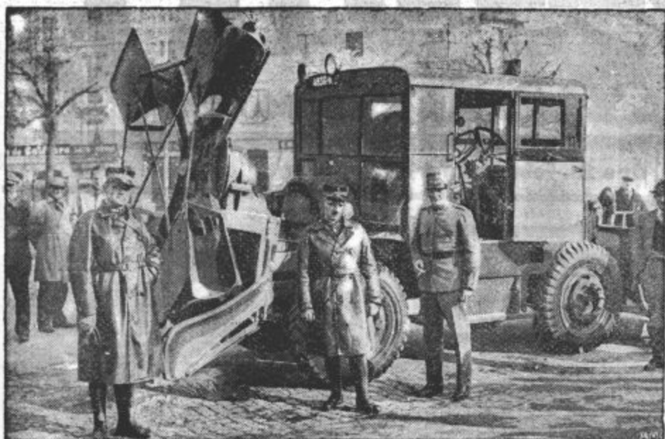
Rotacijski snežni plug, ki čisti švicarske ceste z brzino 20 km na uro