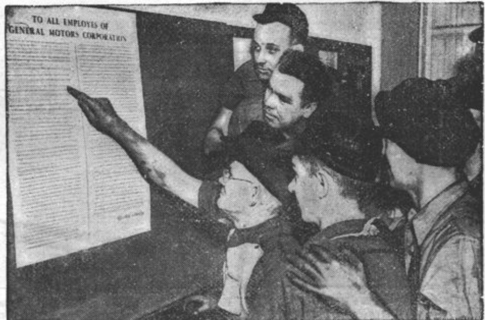
AMERIŠKI DELAVCI STAVKAJO. V Flintu (Michigan) so imeli stavko avtomobilskih delavcev, ki so zasedli tvornice družbe General Motors. Delavci čitajo razglas pred Buickovo tvornico.