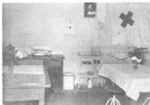
Notranjost dela nove zdravstvene postaje v Benediktu.

DU Lenart bo letos organizirala seminar tudi za vodstva aktivov ZMS.