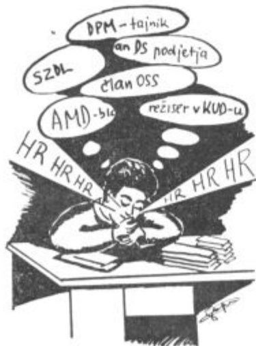
Aktivnost preobremenjenega funkcionarja!

Najpogostejši vzroki smrti so obolenja srca in ožilja, maligne neoplazme (rak) obolenje živčnega sistema (zaradi alkoholizma), obolenje dihal itd.