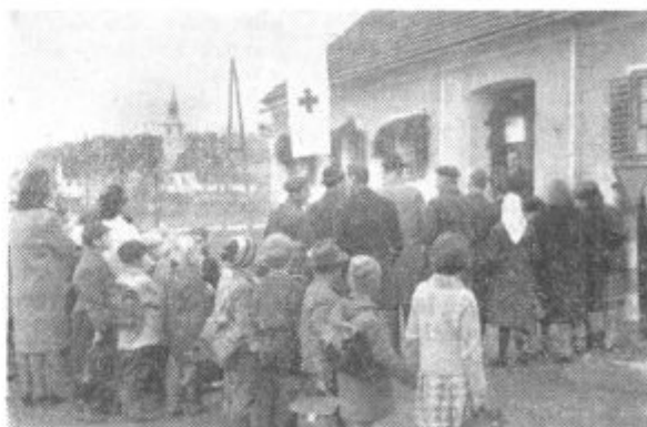
Otvoritev zdravstvene postaje v Benediktu.