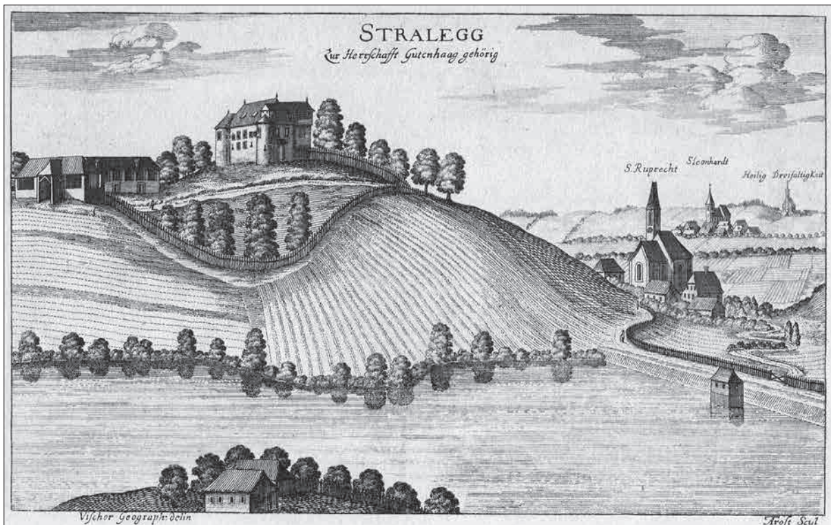
Georg Matthäus Vischer: Veduta dvora Štralek z okolico leta 1681, v ozadju vidna cerkev sv. Trojice z nastajajočim vaškim naseljem, bakrorez, 1681 ( Topographia Ducatus Stiriae , 1681, Cankarjeva založba, 1971, sl. 118).