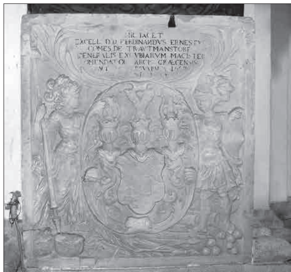
Nagrobna plošča rodbine Trauttmansdorff, cerkev Sv. Trojice v Slovenskih goricah (foto: Oskar Habjanič).

rojstva Device Marije oziroma na dan postavitve podobne Loretanske Matere božje v cerkev Sv. Trojice. Na dan romanja prejme vsak romar popoln odpustek svojih grehov. 67 Naslednje leto je Marija Elizabeta umrla in bila pokopana v loretanski kapeli v Sv. Trojici.