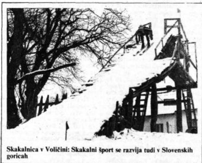
Skakalnica v Votičini: Skakalni šport se razvija tudi v Slovenskih goricah

Med glavne naloge dela združenja lahko štejemo sejamsko dejavnost, s katero predstavljajo obrtniki svoje dosežke občanom, prav tako pa delovnim organizacijam z namenom kooperacijskega povezovanja. Takšno razstavo bomo pripravili tudi v letošnjem letu pri Lenartu v okviru proslav občinskega praznika in 40-letnice osvoboditve.