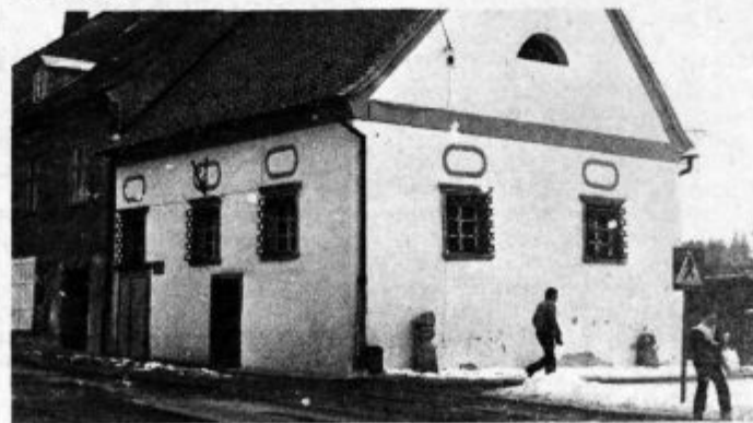
Zgradba lenarškega Rotovža — častljiva letnica nastanka — 1675