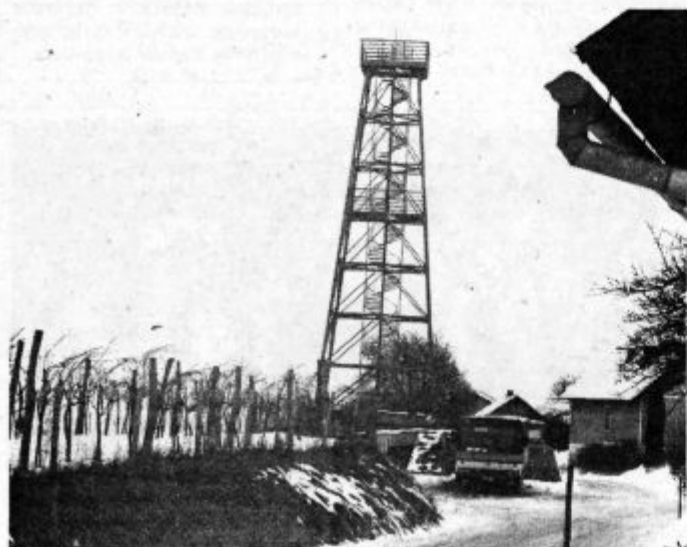
Razgledni stolp na Zavrhu

V prvi fazi združitve obeh strokovnih služb je selitev v skupne prostore, ustanovitev ene delovne skupnosti in s tem poslovanje le-te preko enega žiro računa. V drugi fazi pa je potrebno sprejeti vse samoupravne akte ter oblikovati tako organiziranost, ki bo doprinesla h krepitvi dela delegacij in učinkoviti porabi družbenih sredstev.