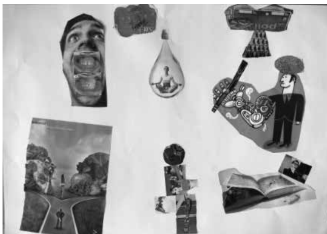
Slike 3, 4 in 5: Fotomontaža, kolaž, 80 x 60 cm