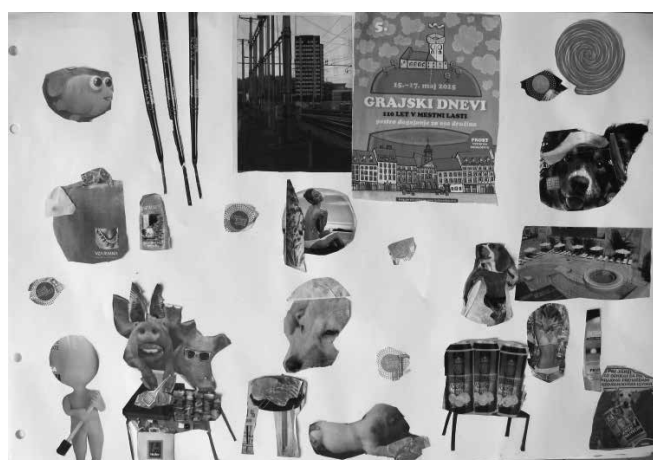
Sliki 7 in 8: Fotomontaža, kolaž, 80 x 60 cm

»Najbolj sta mi bila vseč naša smešna pujsa.«