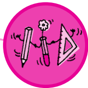
Tabela – razredna tabelska slika