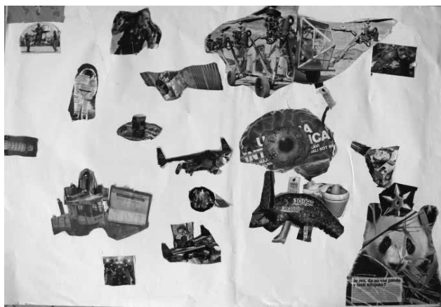
Sliki 9 in 10: Fotomontaža, kolaž, 80 x 60 cm

»Naš plakat govori o življenju čez tisoč let. Jaz sem izrezal tovornjak, sošolec pa raketni pogon in ga dodal. Tretji sošolec je na tovornjak prilepil računalnik. Nenavadni živali smo prilepili možga-