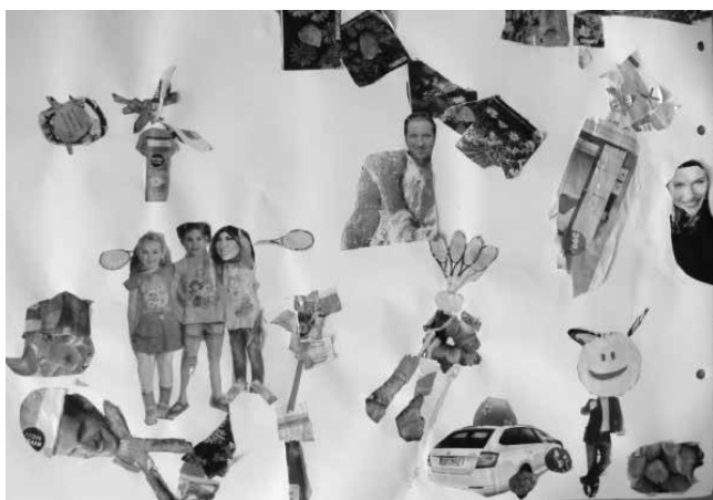
Slika 6: Fotomontaža, kolaž, 80 x 60 cm