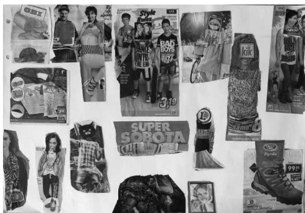
Slike 12, 13 in 14: Fotomontaža, kolaž, 80 x 60 cm