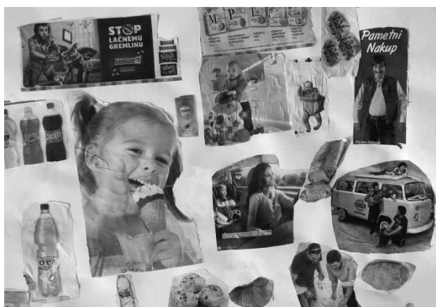
Slika 11: Fotomontaža, kolaž, 80 x 60 cm

ne.« »Naša pošast je imela 2 spreja, eden na hrbtu drugi na možganih, kjer je tudi oko in to pošast so napadali človeki z nahrbtnikom.«