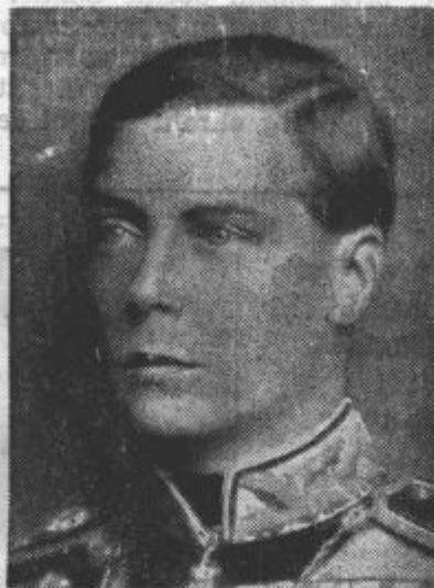
Angleški kralj Edvard VIII.

Preteklo nedeljo je prispel v Jugoslavijo angleški kralj Eduard VIII. Na Jesenicah ga je sprejel Nj. V. knez-namestnik in angleški odpravnik poslov na našem dvoru. Angleški kralj in Nj. Vis. knez Pavle sta se peljala z