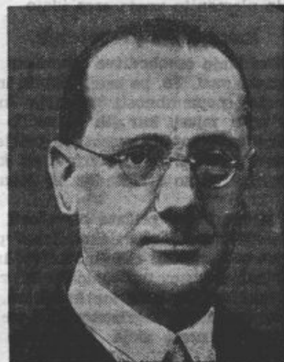
Predsednik obstoječe španske vlade Jose Giral.

s strani Italije. Blumova vlada pa je očitke, češ, da z orožjem in letali podpira španske vladne čete, odločno zavrnila. Desničarsko francosko