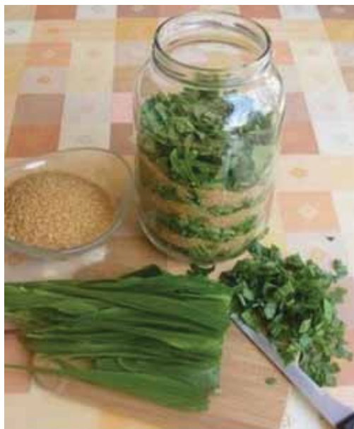
Priprava trpotčevega sirupa.