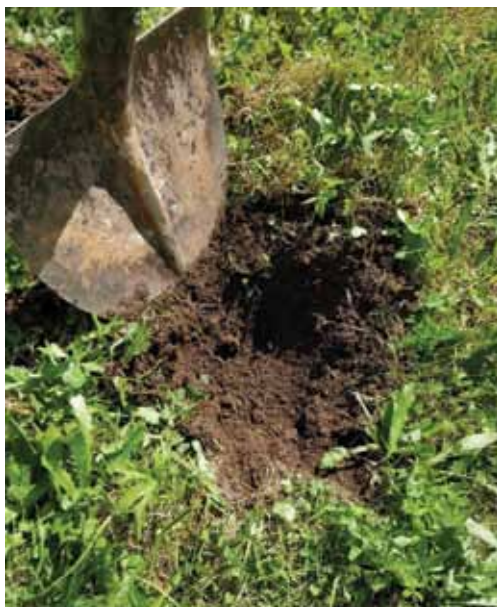
Izkopljemo od 80 do 100 centimetrov globoko jamo.