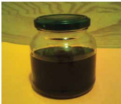
Trpotčev sirup po precejanju.

Trpotčev sirup, ki smo ga pripravile same, res da mogoče ni primeren za prodajo, vendar nam je kljub temu pomagal lajšati kašelj in omilil boleče grlo, zato si upam trditi, da so lahko nekateri naravni pripravki zelo