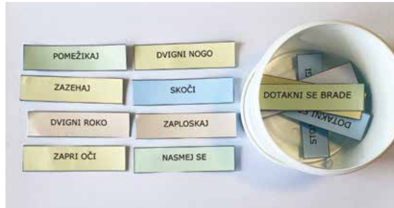
Preberi in pokaži

Na listke napišemo različna kratka navodila, ki od učenca zahtevajo določeno motorično aktivnost, npr. skoči, zaploskaj ipd. Učenec odpre škatlico, v katerem se skriva navodilo, nato pa ga najprej glasno prebere in zatem motorično izvede. S to vajo prejmemo povratno informacijo tudi o otrokovem razumevanju prebrane besede, saj lahko hitro ugotovimo, ali je prebrano navodilo razumel tako dobro, da ga je zmožen tudi pravilno izvesti (Miller 2012).