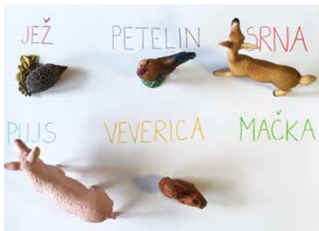
Berem in poiščem

Prinesemo škatlo, v kateri imamo različne (manjše) predmete. Na predlogo zapišemo besede zanje. Učenčeva naloga je, da glasno prebere besedo na predlogi, nato pa nanjo položi ustrezen predmet iz škatle. Z branjem konča takrat, ko mu uspe s predmeti prekriti vse besede. V škatlo lahko damo tudi predmete, ki ne spadajo k nobeni besedi, in s tem otežimo raven naloge.